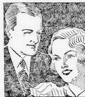
Ha egy hölgy Odol fogkréme használ, bizonyos lehet bájja felől, ha kivullanak fogai

Minden étkezés a szájból savak képződésével jár. E savaknak fogaira gyakorolt hatását ellensúlyozhatja az alkalikus Odol-fogkrém használatával. Ha tehát élete végéig épségben akarja megtartani fogait, használjon minden étkezés után Odol fogkrémet. Az Odol fogkrém alacsony ára mindenkinek lehetővé teszi ezt a szokást.