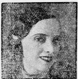
Rendező: B. Sadigurski