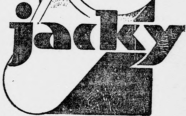
Parfumeria MIGNOT-BOUCHER Paris.

... mint a világhírű mesterek zeneművei — ime ez a „JACKY” kölnivíz: tökéletes egész, a jellegzetes francia „fin” kifejezés illik rá legjobban; az az aprólékos-pontos kísérlete- zés és munka, amelynek eredménye utol- érhetetlen finomság, az illat és az összes követelmények tökéletes har- moniája. „JACKY” kö nív