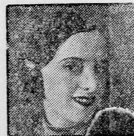
Rendező: B. Sadigurski

Zenekar: SEGALY TESTVÉREK Technikai igazgató Boris Lidin