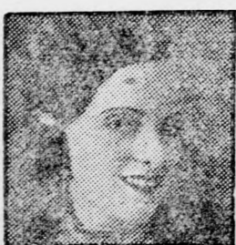
Rendező: B. Sadigurski

Zenekar: SEGALY TESTVÉREK Technikai igazgató Boris Lidin