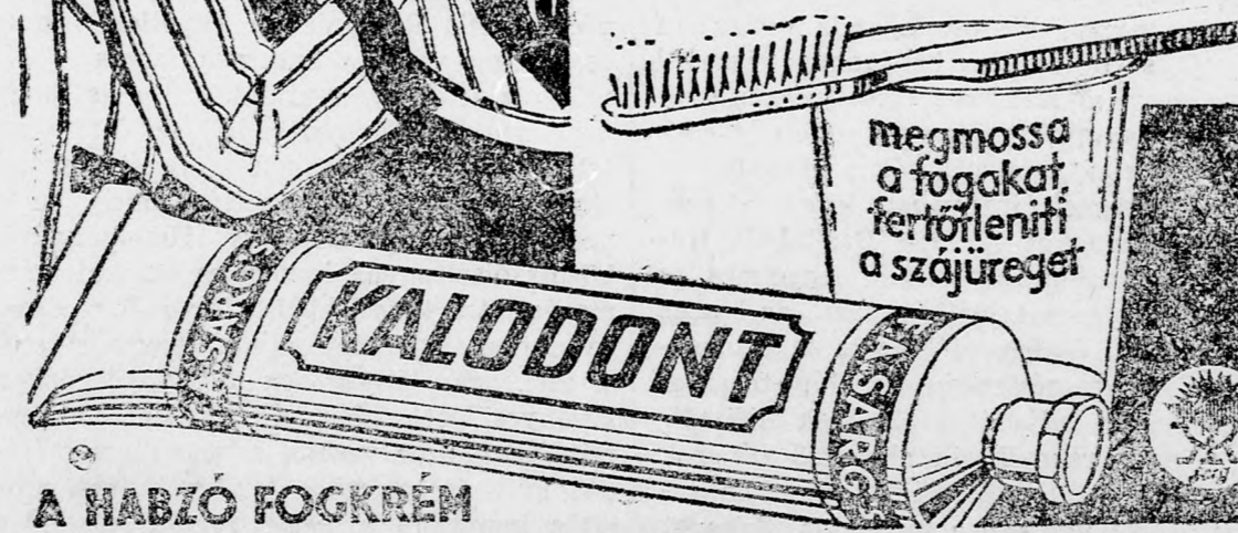
A HABZÓ FOGKRÉM