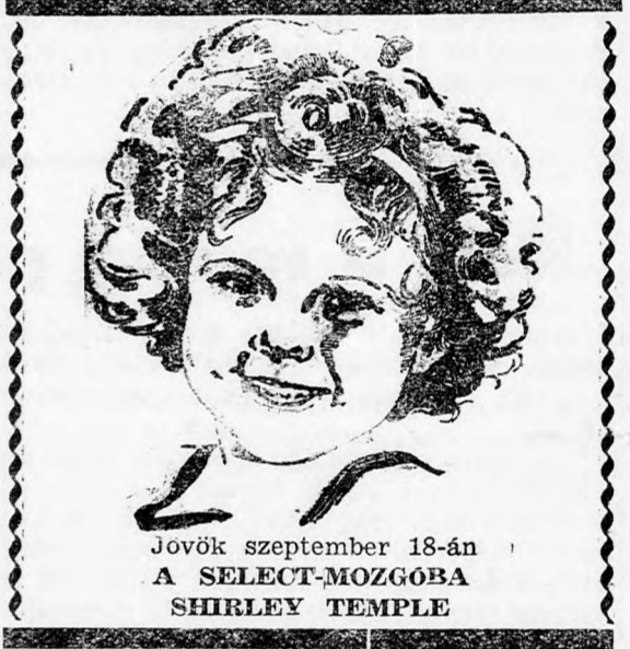
Jövök szeptember 18-án A SELECT-MOZGOBA SHIRLEY TEMPLE

És ez a vámfőnöki „szakértői megállapítás” súlyos következményekkel járt. Mert míg nyersáruknak minősítik az árut, 190 lej vámilletéket fizetnek érte 100 kilónként. Mihélyst azonban a készárurol szóló paragrafus kompetenciájába kerül, — ezt jelentette a vámfőnök szeptember 17-én