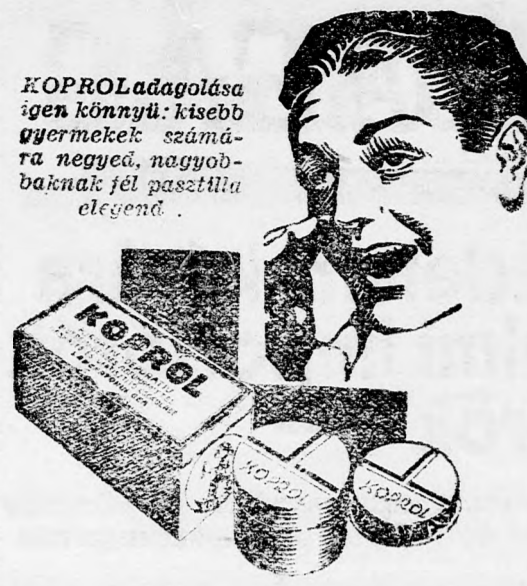
KOPROL adagolása igen könnyű: kisebb gyermekek számára negyed, nagyobbaknak fél pastilla elegendő.