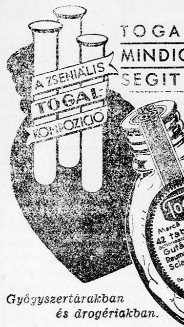
Gyógyszertárakban és drogériákban.

SBTC 10:0 (7:0), Phöbus-Szeged 3:2 (1:1), III. ker.-Törökvs 2:0 (0:0), Zugló-Atilla 2:2 (2:1). A Budafok-Budai mérkőzés a pálya használhatatlansága miatt elmaradt.