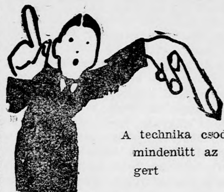
A technika csodája! Kérje mindenütt az utolsó alágert

A zsidó ügyvédek, orvosok, művészek és írók helyzete továbbra is reménytelen, sőt ma súlyosabban, mint volt. A fegyvergyártási konjunktúra gazdasági hatásai azonban bizonyos zsidó üzemekre is kiterjednek, azokra, amelyek valamelyes összefüggésben állnak ezzel az iparral. Ezenkívül van még egy keskeny zsidó ipari réteg, mely szintén érvényesül. Ezzel a kis réteggel szemben áll azoknak hatalmas serege, akik teljesen kihullottak a gazdasági életből és reménytelenül elvesztették kenyereiket. A németországi zsidók körében a kivándorlási láz nagyobb ma, mint valaha. Ha ezelőtt voltak még zsidók, akik optimizmussal várták a nyugodtabb napok eljövését, úgy ma mindenki tisztában van azzal, hogy a nemzeti szocialista mozgalom akarata a német zsidók megsemmisítésére, nem hogy enyhült volna, hanem fokozódott és csak annyiban lehet korlátozásokra számítani, amennyiben azokat belső gazdasági szükségletek és a külpolitika parancsai diktálják. Az utóbbi napokban különösen meglepő hízelgéseknek vagyunk a tanui Németországban Leon Blum személye kapcsán. A „Völkischer Beobachter“ egyszerűen elhallgatja a fran-