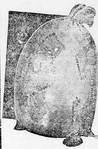
Ne használjon ilyen zsidókat!