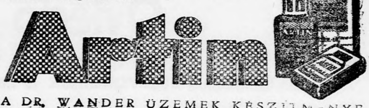
A DR. WANDER ÜZEMEK KÉSZÍTMÉNYE

Sokm vannak, akik a gyógyszertárban egyszerűen „hashajtót” kérnek, ahelyett, hogy kifejezetten „ARTINT” kérnének. Ha azonban vigyáz egészségére és olyan hashajtót akar, amely biztosan, de enyhén hat, anélkül, hogy görcsöket okozna, vagy hasmenést idézne elő, úgy vegyen ARTINT! Ovakodjon az utánzatoktól és vigyázzon a névre és az eredeti csomagolásra. Utasítson vissza értéktelen utánzatokat, amelyek károsak egészségére és amelyek vásárlása csak kidobott pénzt jelent. ARTIN a legjobb modern hashajtó, az orvosi tudomány valóságos kincse.