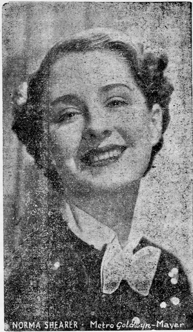
NORMA SHEARER Metro Goldwyn-Mayer

A mikor a mozi leghíresebb csillagai — akiknek módjában áll a legrágább módszereket és a tudomány legutolsó vívmányait igénybe venni — a Pond's krémeket használják, bizonyos lehet afelől, hogy ez ideális módszer, a legjobb, a leghatásosabb.