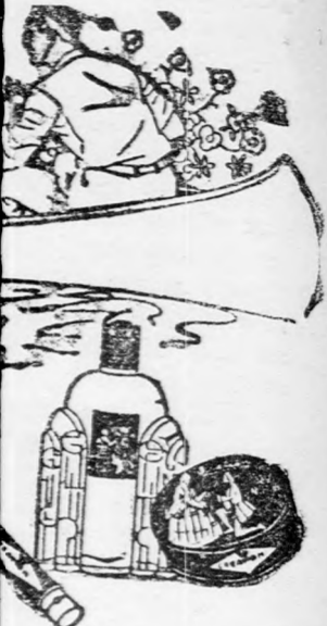
máig használt... szifonyokkal

M. B. márkájú... NIVIZ, ARC... PARFÖMBÖL