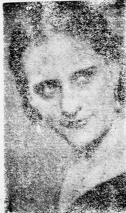
PIA IGY ma este a „Faust” Margaréta szerepét énekli a Román Operában.

Bucuresti, no a román export tegnap kihallg szövetkezeti szolta, hogy a időben nem fo Negura minisz premiúmotok folyósított alap Branovicu m kedelmi minisz valuták leérték zet ügyében in