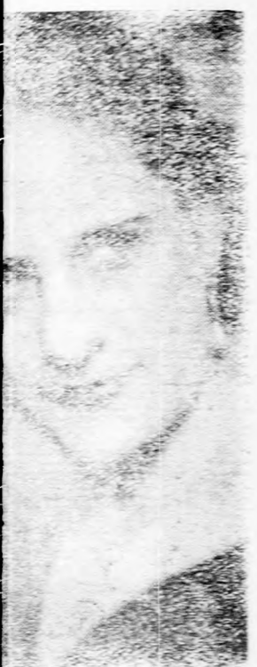
a „Faust” Margaréta a Román Operában.

amiben részesítették és amit a két országot egymáshoz fűző érzelmek ujjabb konkrét bizonyítékának tekint. Az olasz nép mély szimpátiával fog válaszolni erre. Horthy kormányzó római látogatása alkalommal fog nyújtani az olasz népnek a magyar nép iránti érzelmeinek ismételt kifejezésére.