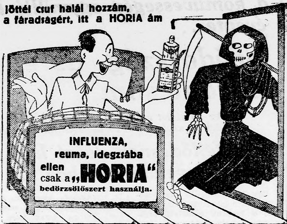
Kapható gyógyszerárakban és drogériákban.

Kiszárvál jöttél csuf halál hozzám, Kár volt a fáradságért, itt a HORIA ám