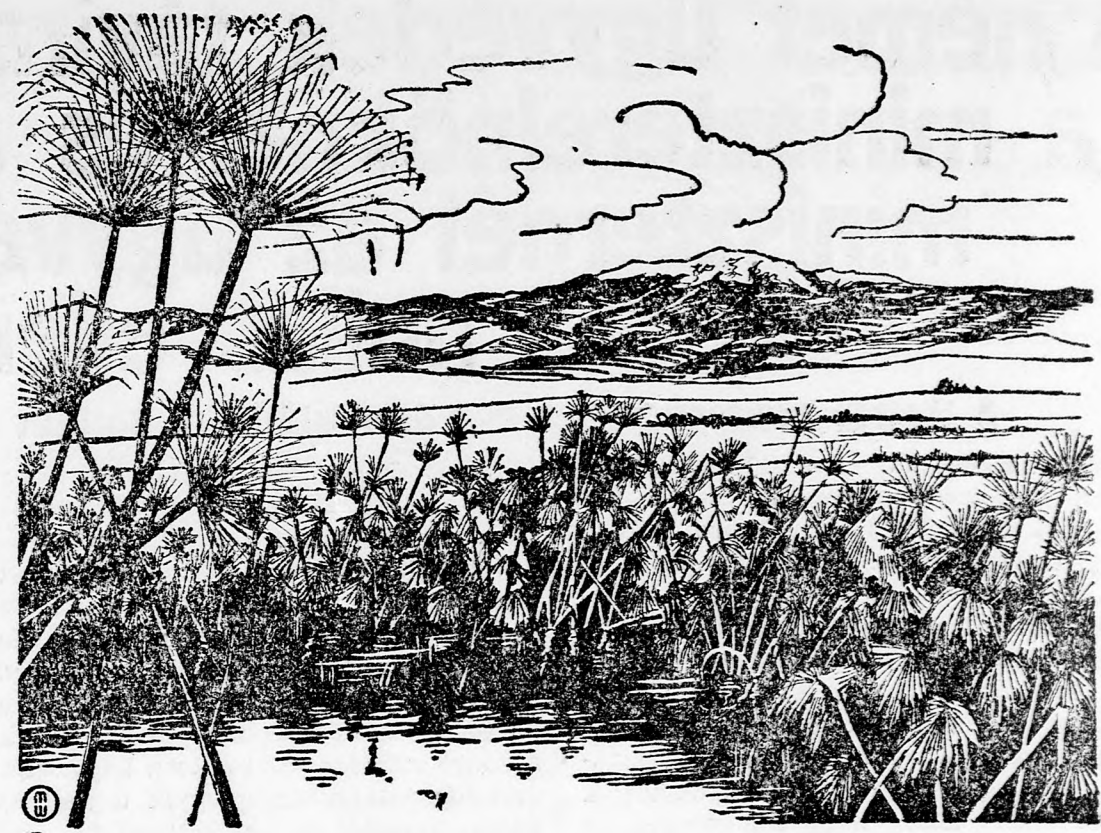
A Keren Kajemet újból kiadja a jelszót: Fel Felső-Gallileába! A Hule környéke körül a telepítéseknek virágzó koszoruját akarja megteremteni, egy összefüggő zsidó területet Daganjától Mentulláig. Ez a leghatásosabb felelet Erec Jisráél feldarabolásának tervére.

Bölcs és higgadt elgondolásra vall a tanítósságnak azon álláspontja is, hogy az iskola szemlemének kidomborítása tekintetében nem fogadott el határozott direktívákat, hanem az egyes tantestületekre biza