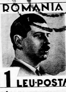
ROMANIA 1 LEU-POSTA

Tára postala póstita in nana. No. 224718/929. Szerkesztőség és kiadóhiva- tal: Cluj, Str. Baron L. Pao 10. Telefon: 8-61. Előfizetési ár: Havonta 110, negyedévre 320, f- évre 600, egészévre 1200 lej. K- földre: Havonta 2, negyedévre félre 12, egészévre 20 dollár. H- detések díjszabás szerint. Az „ KELET” a transilvaniai és ban- zsidóság egyetlen politikai napila- ja. Cikkjeink utánnomását csak forrás megjelölésével engedjük me-