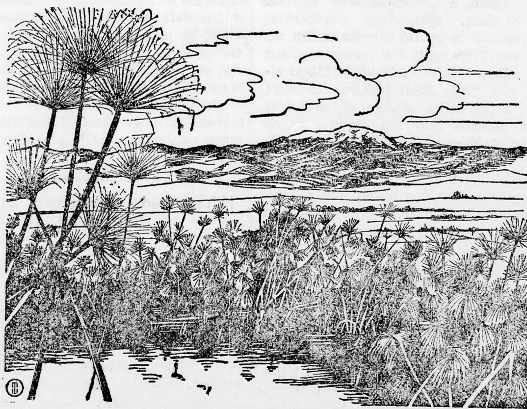
A Keren Kajemet újból kiadja a jelszót: Fel Felső-Gallileába! A Hule környéke körüli a telepítéseknek virágzó koszorúját akarja megteremteni, egy összefüggő zsidó területet Daganjától Mentulláig. Ez a leghatásosabb felelet Erec Jiszraél feldarabolásának tervére.

sőt kormánylistákat is lanszíroznak már az új arab állam terveivel kapcsolatban és eszerint Nashashibi volna Abdullah király ságának miniszterelnöke. Ezeket a verziókat természetesen a legnagyobb fenntartással kell fogadni.