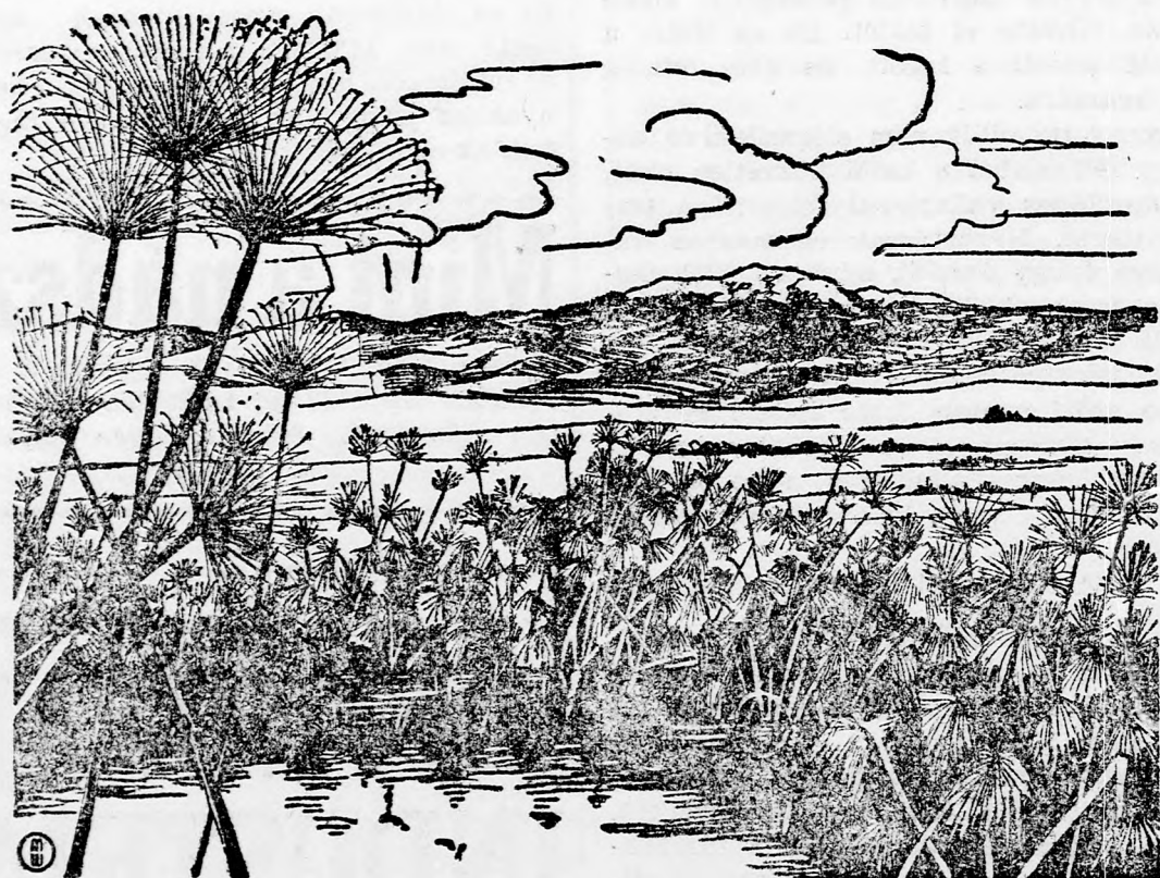
A Keren Kajemet újból kiadja a jelszót: Fel Felső-Gallileába! A Hule környéke körül a telepítéseknek virágzó koszorúját alkotja megteremtési, egy összefüggő zsidó területet Daganjától Mentulláig. Ez a leghatásosabb felelet Erec Jiszraél földarabolásának tervére.

Könyv- és Lapkiadó Részvénytársaság nyomdájában Cluj, Str. Barza L. Pop 10. Telefon: 8-61.