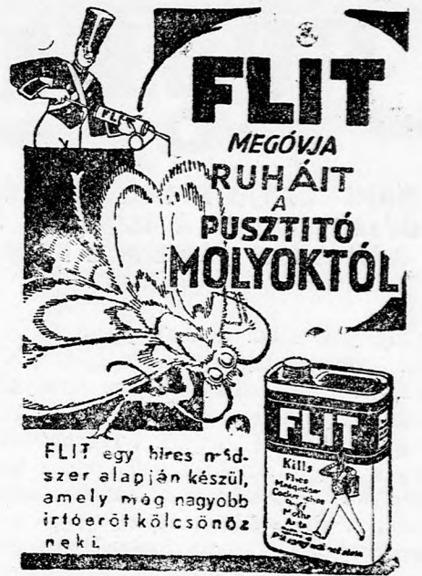
FLIT egy híres n. f. d. szer alapján készült, amely mag nagyobb irtóerőt kölcsönöz neki.

Kezünk most dróttal volt összekötözve, oly szorosan, hogy sokan közülünk azután napokig nem tudták használni a kezüket. Teherautókon Navalcanseoba vitték bennünket,