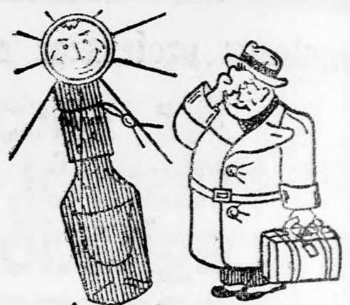
Lehűt és frissít a „Liana” sóborsszel való enyhe ledörzsölés.

bucuresti székhellyel 5 millió lej alaptőkével részvénytársasággá alakult. A vállalat hentesárugyártáson kívül élőállatexporthal is foglalkozik.