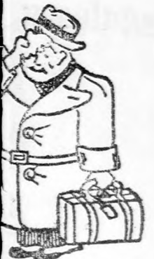
frissít borzselem ledörnyölés.

illió lej alaptökével t. A vállalat hen- állatexporthal is fog