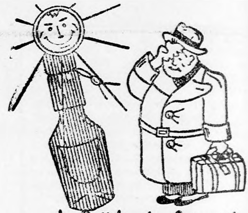
Lehűt és fűsít a „Diana”-szoborral való embe ledörzsölés.

A jelen, a ma, azonban gondolt a kongresszusra. Azon a drámai éjszakán, amikor a súlyos elhatározás izgalma tetőfokára hágott a cionista parlamentben, uccai felvonulást rendezett és beordította a színház zsufolt csarnokába: „Le a zsidókkal!”