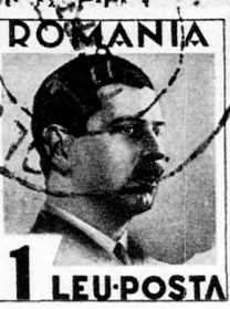
ROMANIA 1 LEU-POSTA

10. Telefon: 8-61. Előfizetés: Havonta 110, negyedévesre évre 600, egészévre 1200 földre: Havonta 2, negyedévesre félre 12, egészévre 20 detések díjazásában szerin KELET" a transilvaniai zsidóság egyetlen politikai forrás megjelölésével eng-