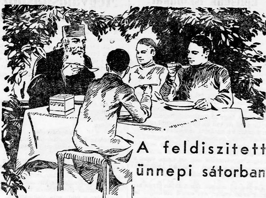
A feldiszített ünnepi sátorban

Senki sem mulaszthatja el a választói név- jegyzékben való felvételét, mivel politikai jo- gának gyakorlása a mai súlyos időkben min- den zsidónak elsőrendű kötelessége.