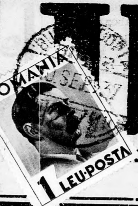
1 LEU POSTA

10. Telefon: 8-61. Előfizetési árak: Havonta 110, negyedévre 320, fél-évre 600, egészévre 1200 lej.