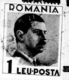
ROMANIA 1 LEU-POSTA

Taxa postala plátte in num. No. 224713.929. Szerkesztőség és kiadóhiva- tal: Cluj, Str. Baron L. Pop 10. Telefon: 18-60. Előfizetési áfak: Havonta 110, negyedévre 320, fél- évre 600, egészévre 1200 lej. Kül- földre: Havonta 2, negyedévre 6, fél- évre 12, egészévre 20 dollár. Hir- detések díjszabás szerint. Az „UJ KELET” a transilvaniai és banati zsidóság egyetlen politikai napilap- ja. Cikkeink utányomását csak a forrás megjelölésével engedjük meg.