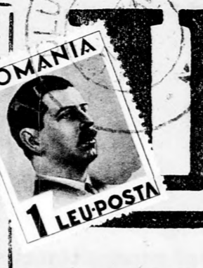
ROMANIA 1 LEUPOSTA

Taxa postala plátite in num. No. 224713/929. Szerkesztőség és kiadóhiva- tal: Cluj, Str. Baron L. 10. Telefon: 18-60. Előfizetési Havonta 110, negyedévre 320, évre 600, egészévre 1200 lej. K földre: Havonta 2, negyedévre félre 12, egészévre 20 dollár. Hi- detések díjazás szerint. Az „Uj KELET” a transilvaniái és banati zsídóság egyetlen politikai napilap- ja. Cikkeink utánnomását csak a forrás megjelölésével engedjük meg.