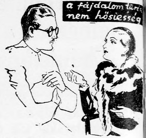
a fájdalom tünete nem hősiesség

inkább ostobaság, mert nem használ. Ellenkezőleg, a fájdalmak gyengítik ellenállóképességünket, csökkentik életenergiánkat és sorvasztják testünket. Ezekből a megfontolásból következnek az a hihetetlen kedveltség, melynek minden fájdalmat azonnal megszünteti.