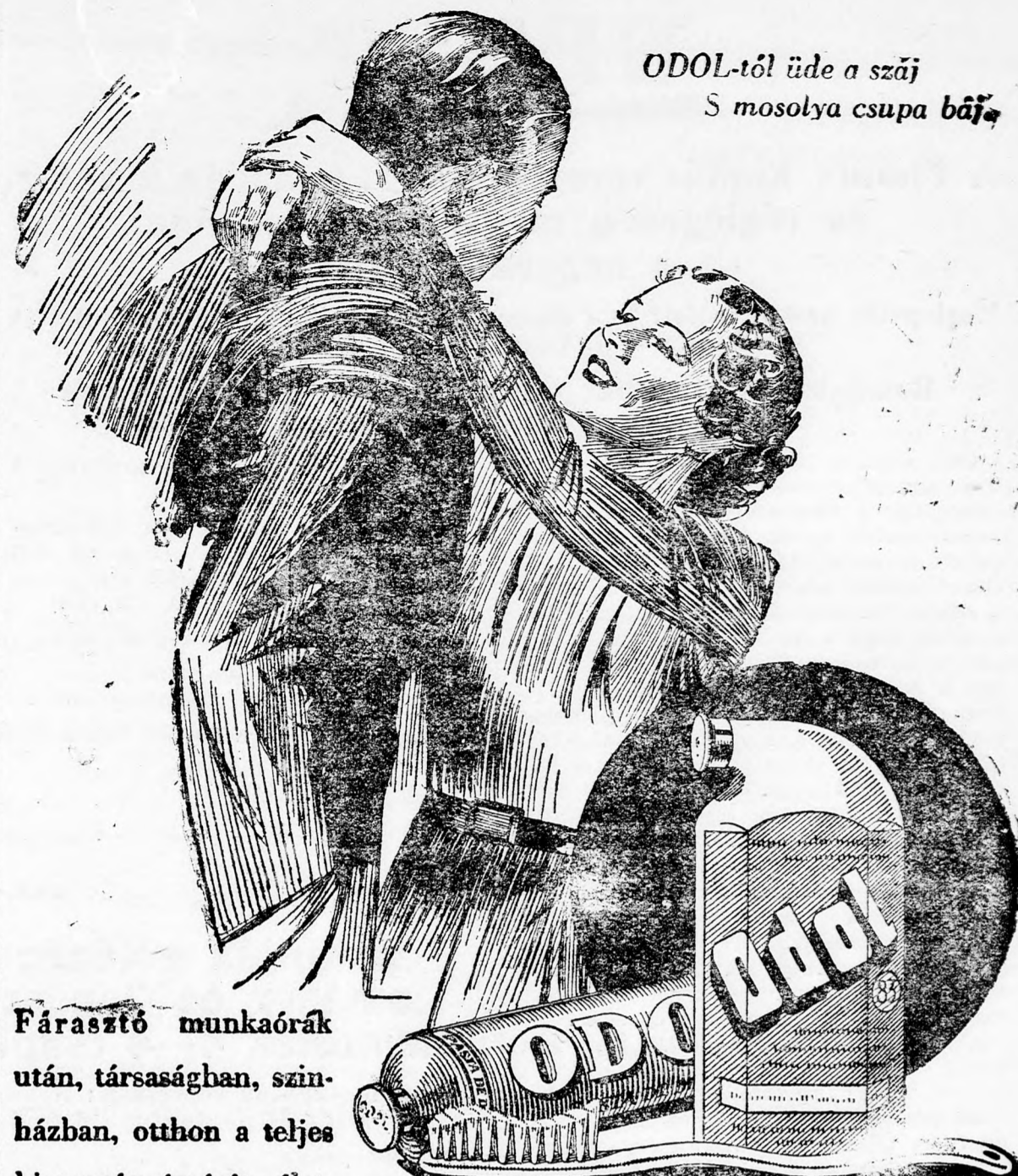
ODOL-tól üde a száj S mosolya csupa báj

Sanghai jelentés szerint egy japán cseredőr-különítmény elfoglalta a Nanking-Road egy részét, a nemzetközi engedményes területen arra való hivatkozással, hogy egy