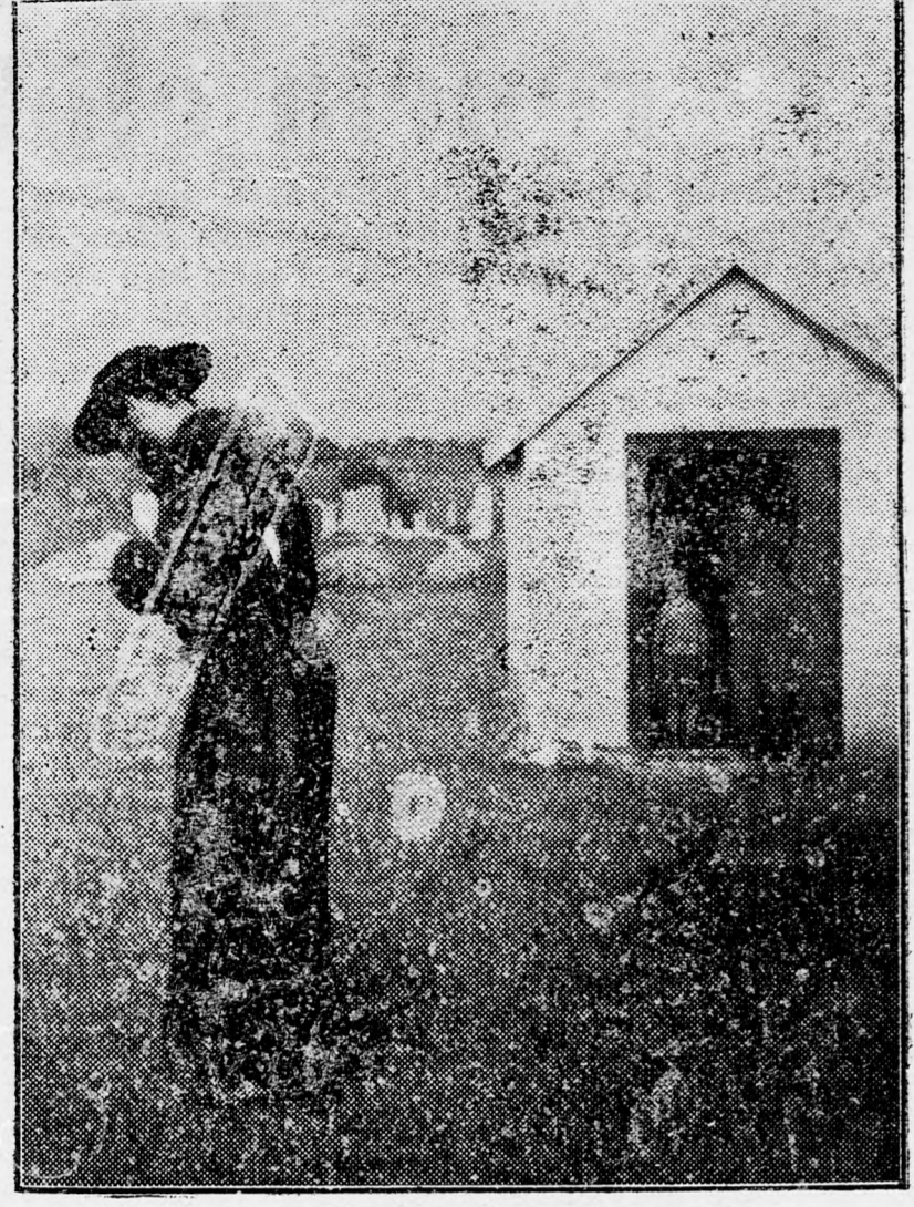
Egy kvitli-iró; háttérben az „ohel”

Akkor már az „ohelben” és a sírház körül sokan állottak mély imába merülve. Az égő gyertyák sokasága koszoruzta a sírdomb fölé emelt deszkázott részt, amely előtt áll a fehér termésköböl faragott síremlék az egyszerű felirattal: