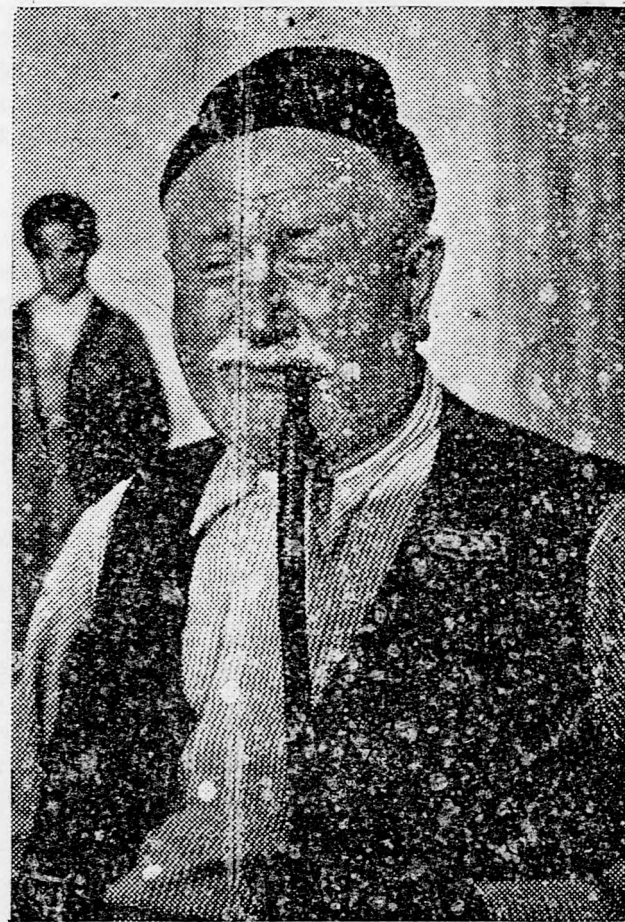
Egy megelégedett lupsai