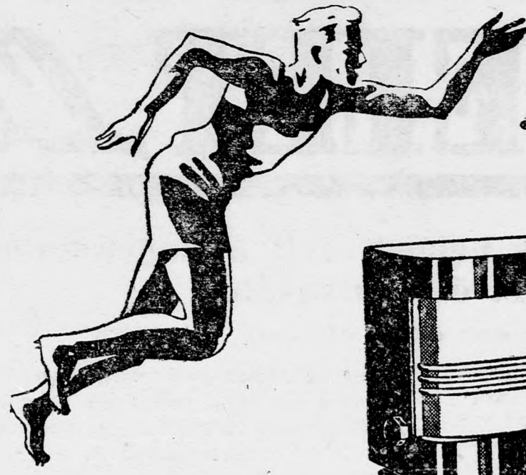
A hang és teljesítőképeség

A VIII-ik világszoda. Minden idők leghatalmasabb filmalkotása. Deanna Durbin és Stokowski (Garbo férje) „100 férfi és egy kislány”. Zene: Verdi, Liszt, Mozart, Wagner. Számozott jegyelvétel délelőtt 11 órától. Telefon 37-05. Kedvezményes és szabadjegyek érvénytelenek.