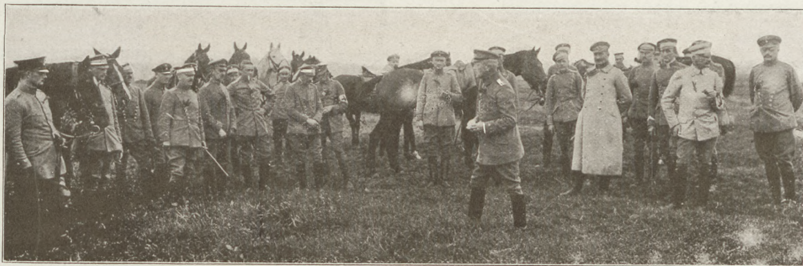
A német 5. ulánus-ezred tisztikara megbeszélést tart a front mögött.

rajta. Az ilyen tömegeket sohasem dominálja intellektuális jellegzetesség és sohasem visznek végbe oly dolgokat, a mikhez nagy szellemi képességek szükségesek.»