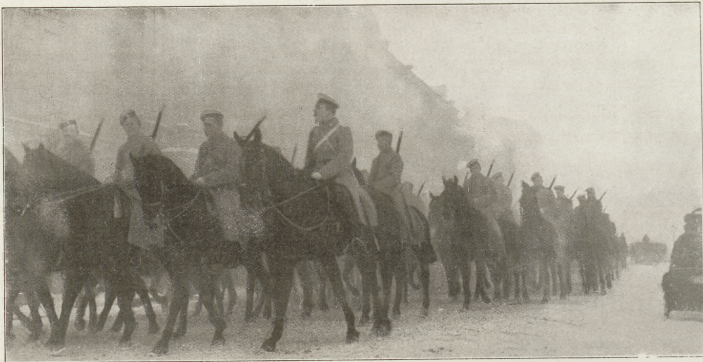
Orosz gárdalovasság átvonulása Varsón.