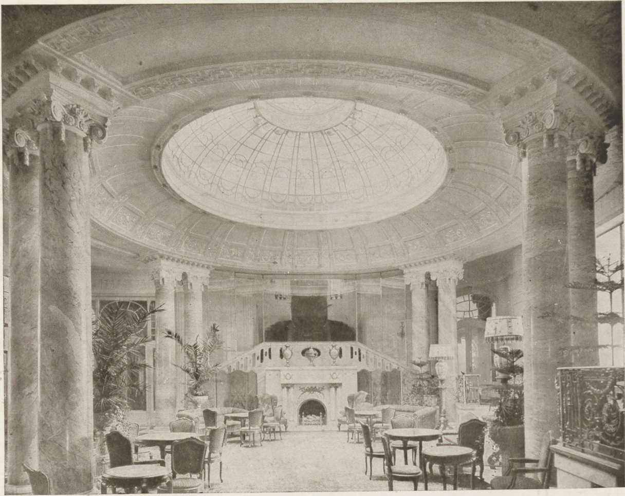
A Ritz az előkelő társaság szállója.