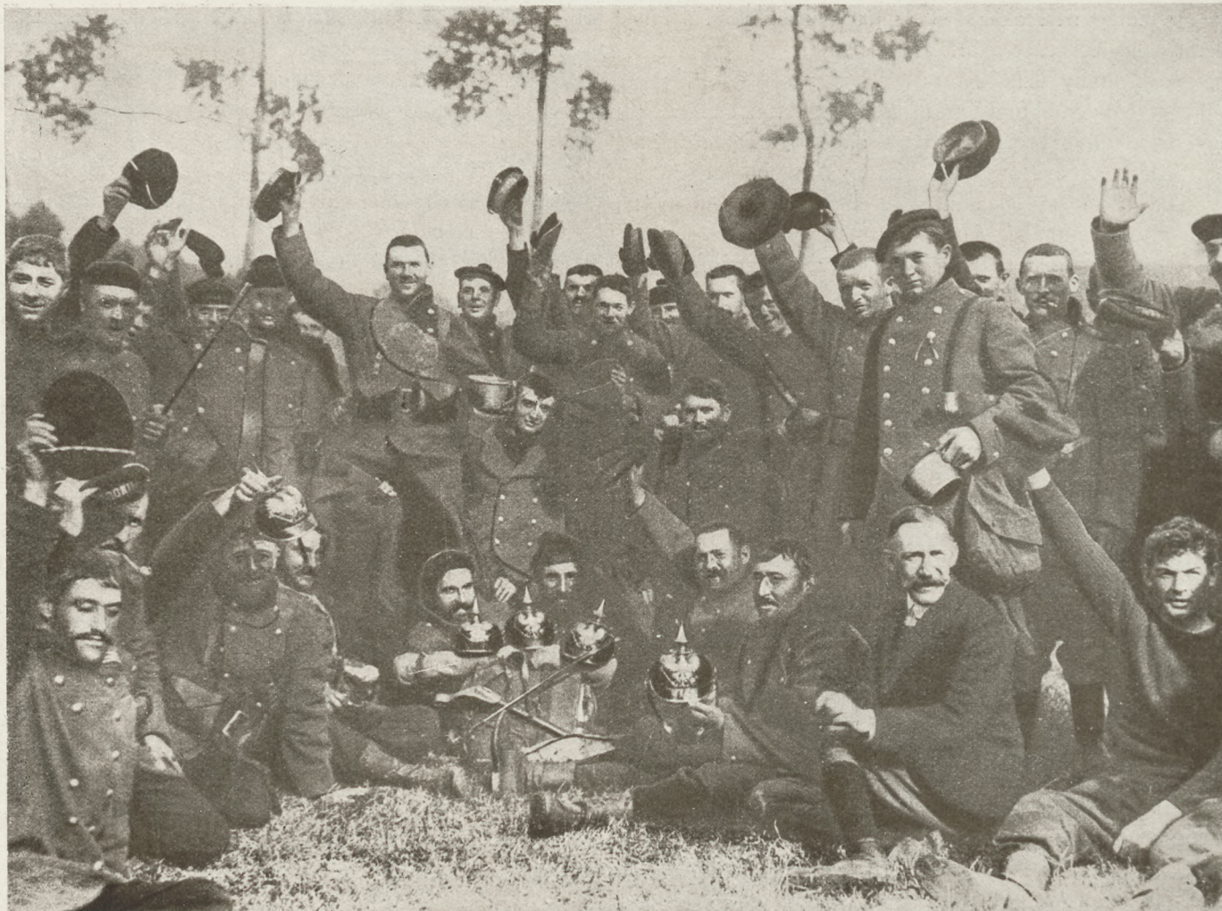
Olcso dicsőség : Angol katonák elesett német katonáktól zsákmányolt sisakkal stb. a fényképező gép előtt.

Az asszony megnézte a képet, letette s azután szóltanul állt egy darabig.