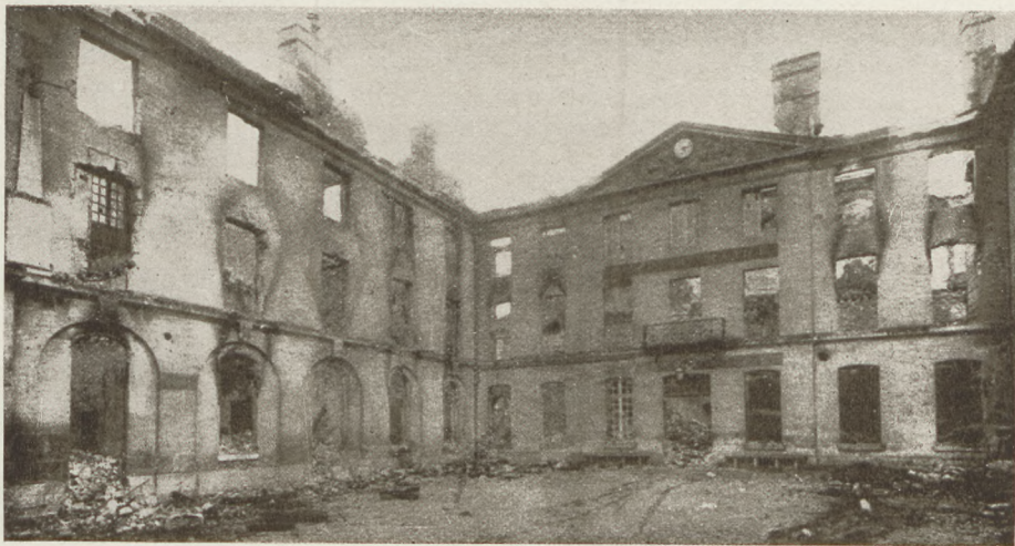
Feldult kastély Lengyelországban.

Tizenhetedikén délután Rzeszówra értünk. Megint egy nagy civilházba vittek minket tiszteket fel. Háromszobás lakást utaltak ki az első emeleten. Megkezdődött az éjszakára való berendezkedés. A tisztilegények szalmát hordoztak valahonnan. A négy kísérő orosz bent őgyelgett a szobákban, drága pénzen árulgatták a komisz cigarettákat, cukrot, teát. Zugott a fejem, friss levegőre vágyva kimentem a folyosóra. Nagy kétemeletes bérház volt, köröskörül rácsos ganggal. A lakás bejárata előtt senkisémm állott még. A katonák bent voltak a szobában. Egy gondolat villant meg agyamban. A következő pillanatban fölszaladtam a második emeletre. Egy zsidó támaszkodott a rácshoz, s szándékomat megértve rámutatott a padlás vasajtájára. Egy izgatott ugrás, fent voltam a padon. A hideg levegő megcsapta arcomat, szabad voltam. Lassanként besötétedett, kezdtem nyugtalan lenni, hátha keresni tálálnak. Előmásztam rejtekemből, lejöttem a gangra, próbáltam bejutni valamelyik lakásba. Mindenhol sötét volt az ablak, zárva az ajtó, sok helyütt azonban betörve az ablaküveg. Bemásztam, üres kifosztott szobák. Kétségbeesve lementem az első emeletre s rémülten láttam a fogoly tisztek lakása előtt a már föllállított hat orosz katonát. Visszatértem a második emeletre, minden üres, kihalt, koromsötét. Egyszerre csak éppen a mi lakásunk fölött megláttam egy fényes ablakot. Hevesen dobogott a szívem, most vagy soha, izgatottan kinyitottam az ajtót. Meg voltam mentve.