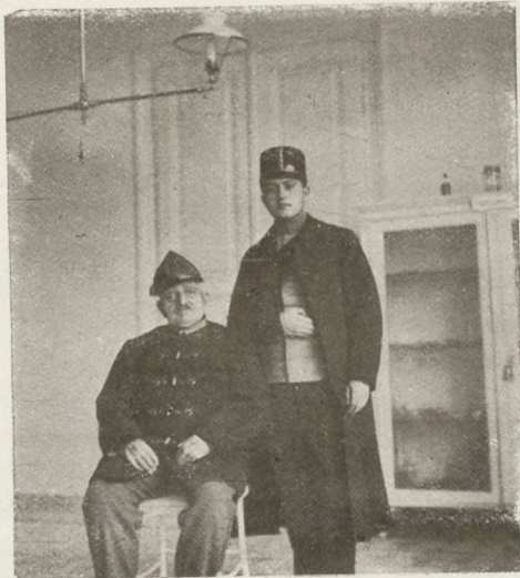
Bornemissza 48-as honvédhadnagy egy sebesült hadnaggal a honv. helyőrségi kórházban.