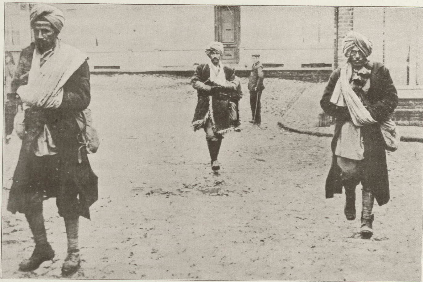
Sebesült indus katonák egy yperni kórház udvarán.