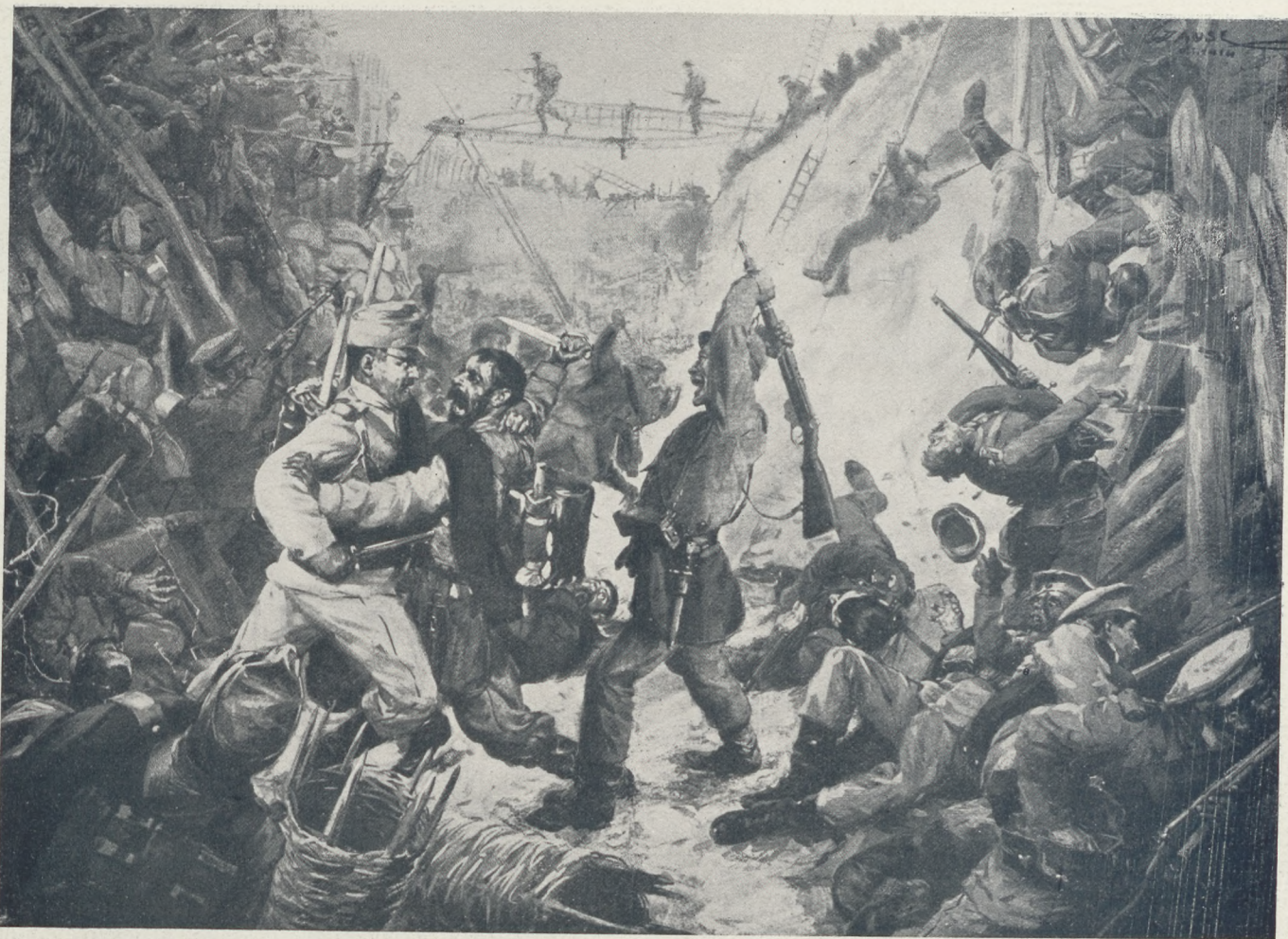
Przemysl ostromából: A »The Sun« amerikai napilap illusztrációja, melynek aláírása szerint az orosz holttestek 12 lábnyi magasságban heverték a vár falai alatt.

mészeti törvényt, a mely az emberek életfentartási ösztönéből indítja meg az ellenfélre való támadást. Vannak, akik az ember ősi vadságának atavisztikus felbukkanásából keletkeztetik az életre törő vérengzést. Sokan gazdasági érdekeket vádolnak a háboru egyedüli oka gyanánt, mivel csakis ilyen érdekelletétekből származhatnak az igazi összeütközések, legyen bár a tenger vagy a szárazföld a birtokvágnak alanya. Ujabbán egyesek kizárólag a kultura gyermekének vallják a bajt, mondván, hogy az ember fegyvertelenül jön a világra és fegyverei ugyszintén a háborut kiváltó ellentétei csupán a kulturával születnek meg és evvel növekednek nagyra. Szerintük a magasabb művelődéssel arányban fognak majdan egykor csökkenni a népek közötti feszültségek fegyveres kisülései.