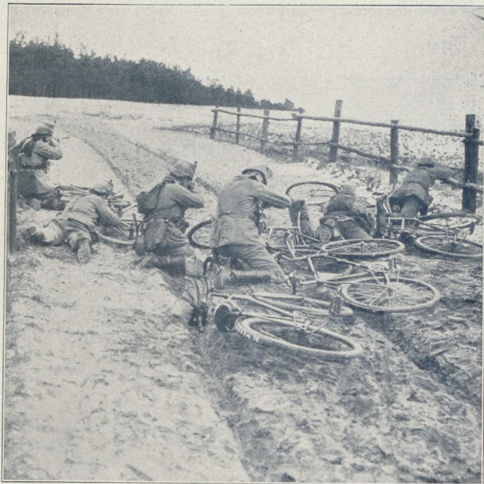
A nyugati harcterről: Egy német kerékpárosztag ellenséges támadásra talál.