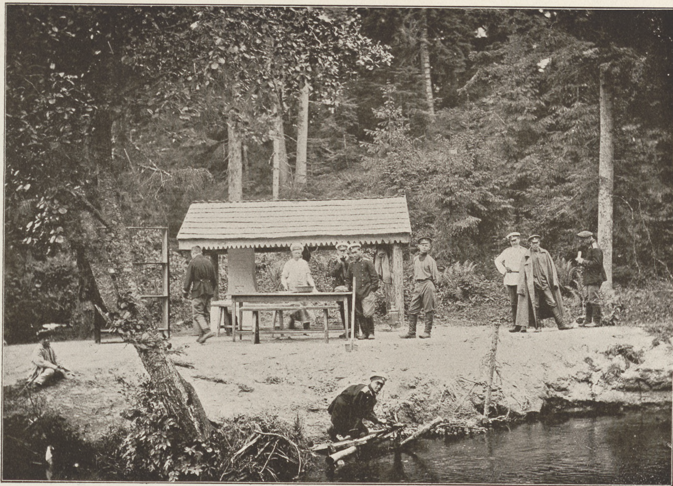
Orosz határőrség a román határon.