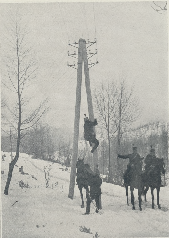
A déli harctérről: Huszárajaink felderítő szolgálatban.