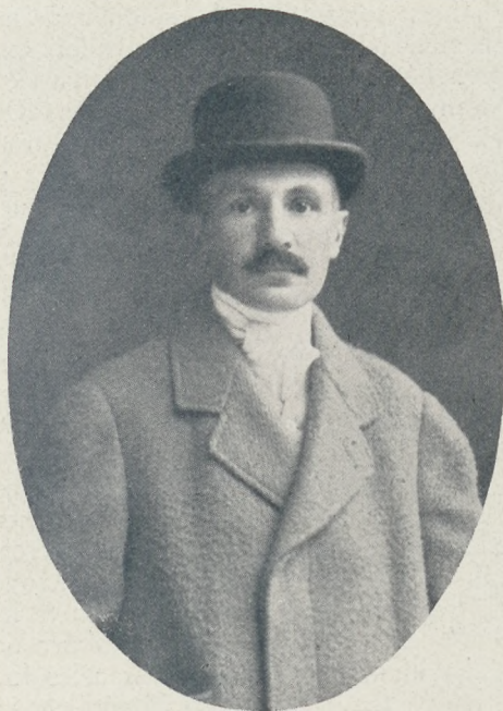
Lovik Károly †

A magyar szépirodalom egyik leghivatottabb művelője, az elegáns tollu, finomlelkű novellista meghalt 1915. április 19. Mint a lóspört kiváló szakembere is marandó nevet szerzett magának.