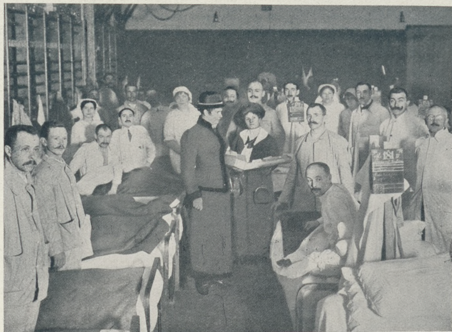
Augusztai kir. hercegnő látogatása az Áldás-utcai hadikórházban.