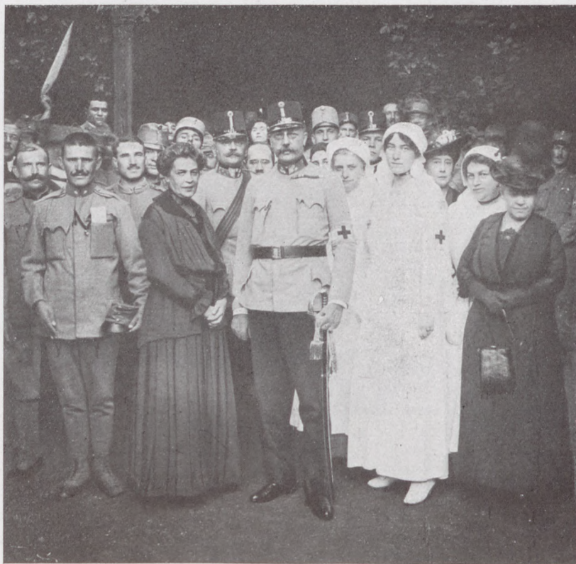
Ferenc Salvátor főherceg a minap meglátogatta a váci-úti katonai üdülőtelepet. A főherceg mellett Khuen-Héderváry Károlyné grófné, a magyar Vörös kereszt elnöknője áll.