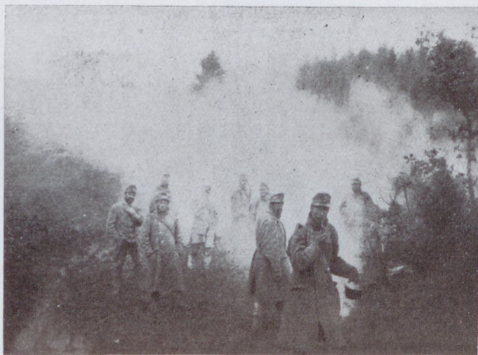
Mikor a jó gulyást kiosztják.