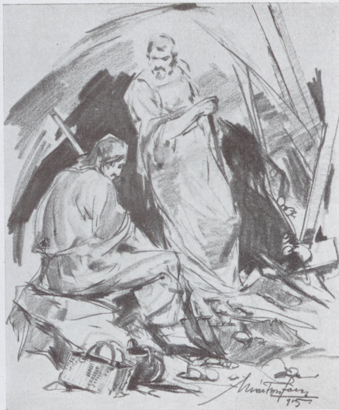
— Ruth nagyon jó asszony, — bólintott Kiljon.

— Félek, hogy kikacagnak a szomszéd pásztorok.