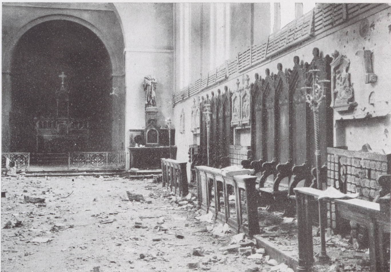
A galíciai harcokból: Egy Sacré Coeur-zárda temploma csata után.