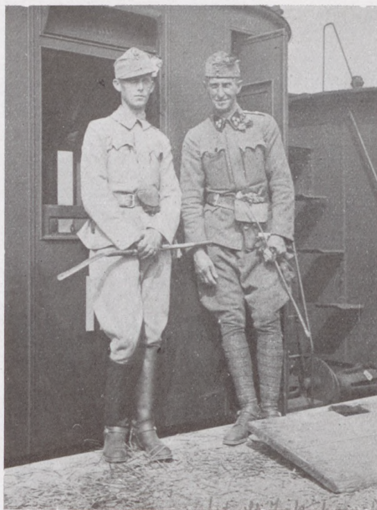
A húszéves Vilmos kir. herceg, Károly István királyi herceg fia, a ki az idén márciusban került ki a bécsujhelyi akadémiából, mint 13-as ulánushadnagy Kratochwill Ferenc kapitány kíséretében a harctérre utazik.

Egyik szük völgyből a másikba kanyarodtunk, többnyire emelkedéssel. El-elgondoltam, mekkora lehet a hangtalanság ezekben a