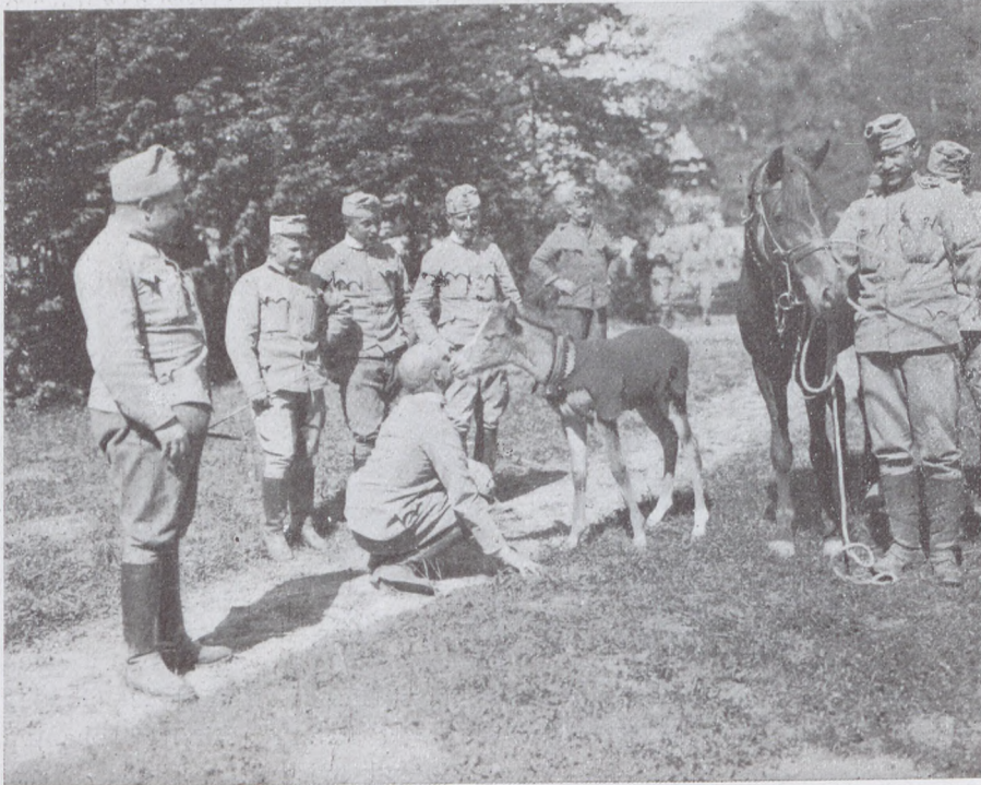
5-ös komáromi tüzértisztek az ezred csikájával az északi harctéren.