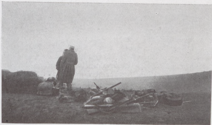
Az északi harctéren : Csata után összegyűjtik a hadizsákmányt.