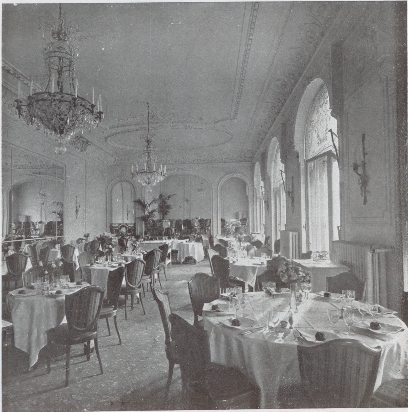
A Ritz az előkelő társaság szállója.