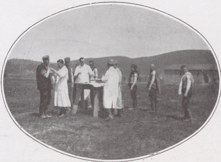
Muszka foglyok kolera ellen való beoltása a harctéri foglyokórházban.

Egyenes Vendel azonban megboszulta magát az igazságtalan korholásért, a feleket ezen a napon egy órával tovább váratta az ablaknál!