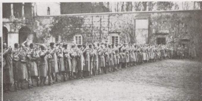
A lengyel légió parancsnoka és vezérkara. A lengyel légió tagjai esküt tesznek.