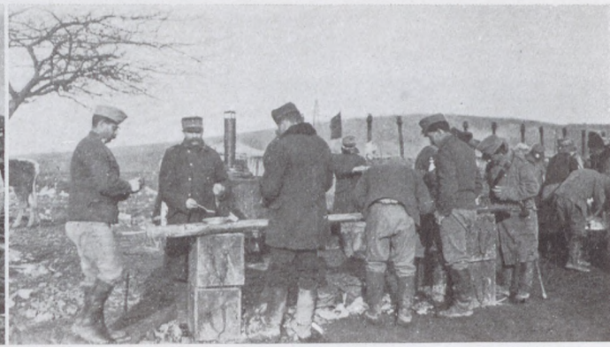
Az északi harctérről: Készül az ebéd.