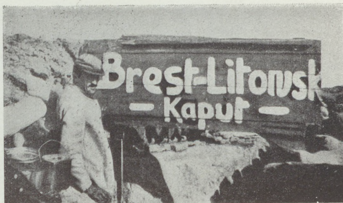
Brest-Litovszk elestének kihirdetése a lövészárkokban.