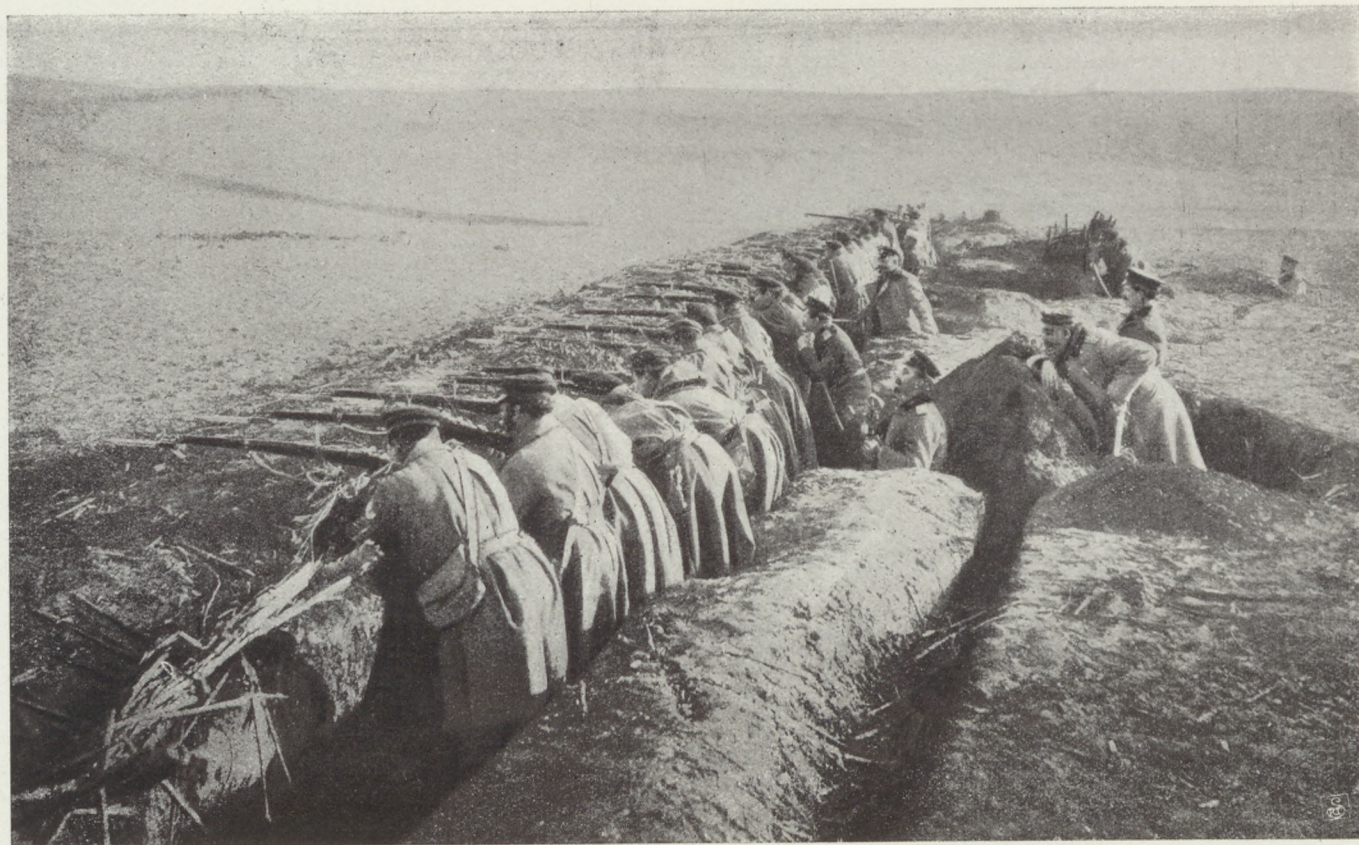
Bolgár-szerb háború: Bolgár lövészárók és tiszt megfigyelőhely.