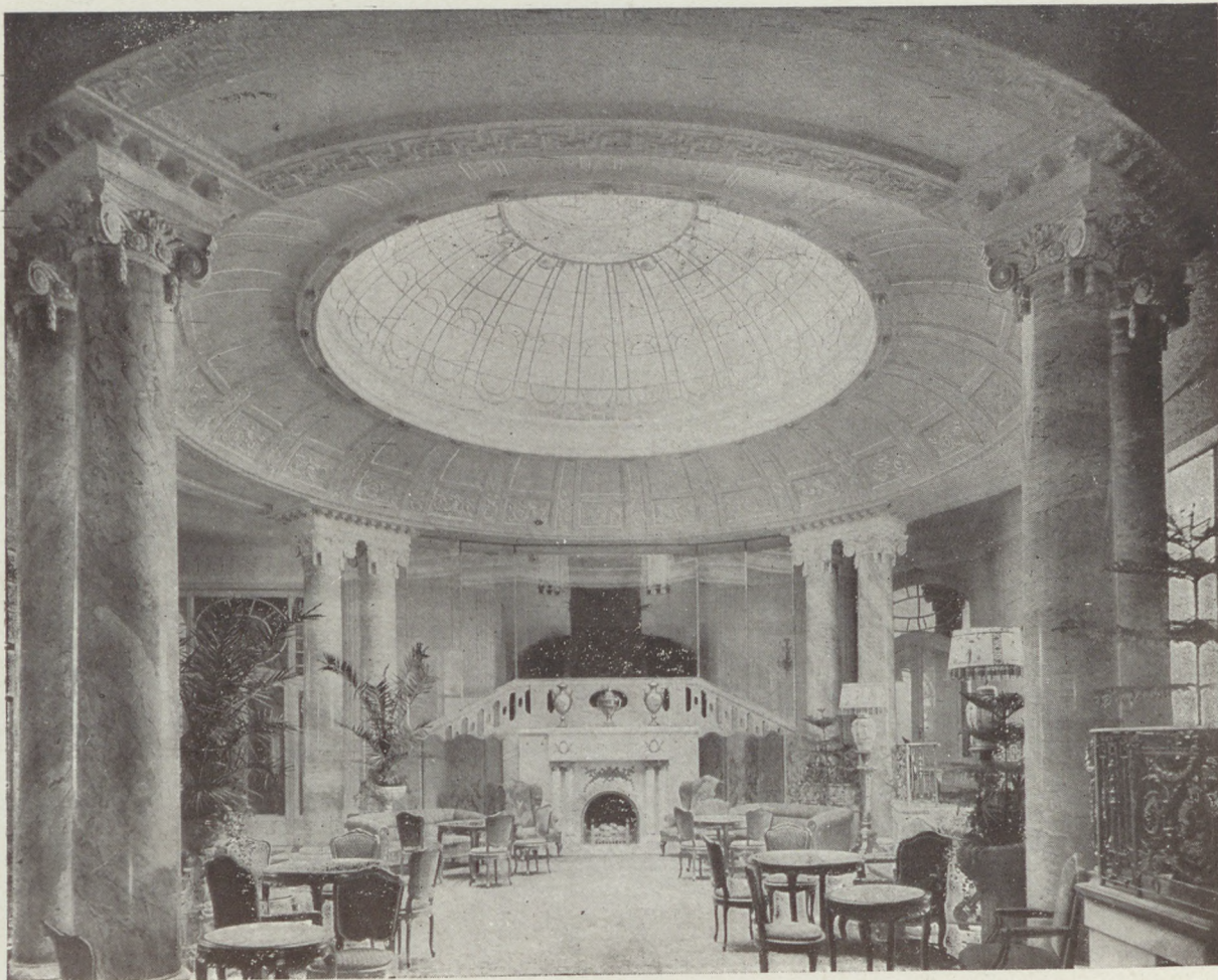
A Ritz az előkelő társaság szállója.