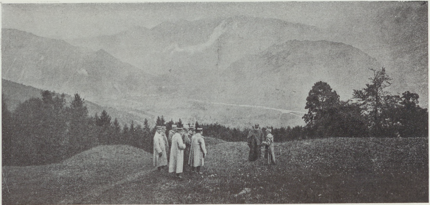
Joffre és az olasz király az olasz főhadiszálláson. A háttérben az Isonzo-folyó látszik.