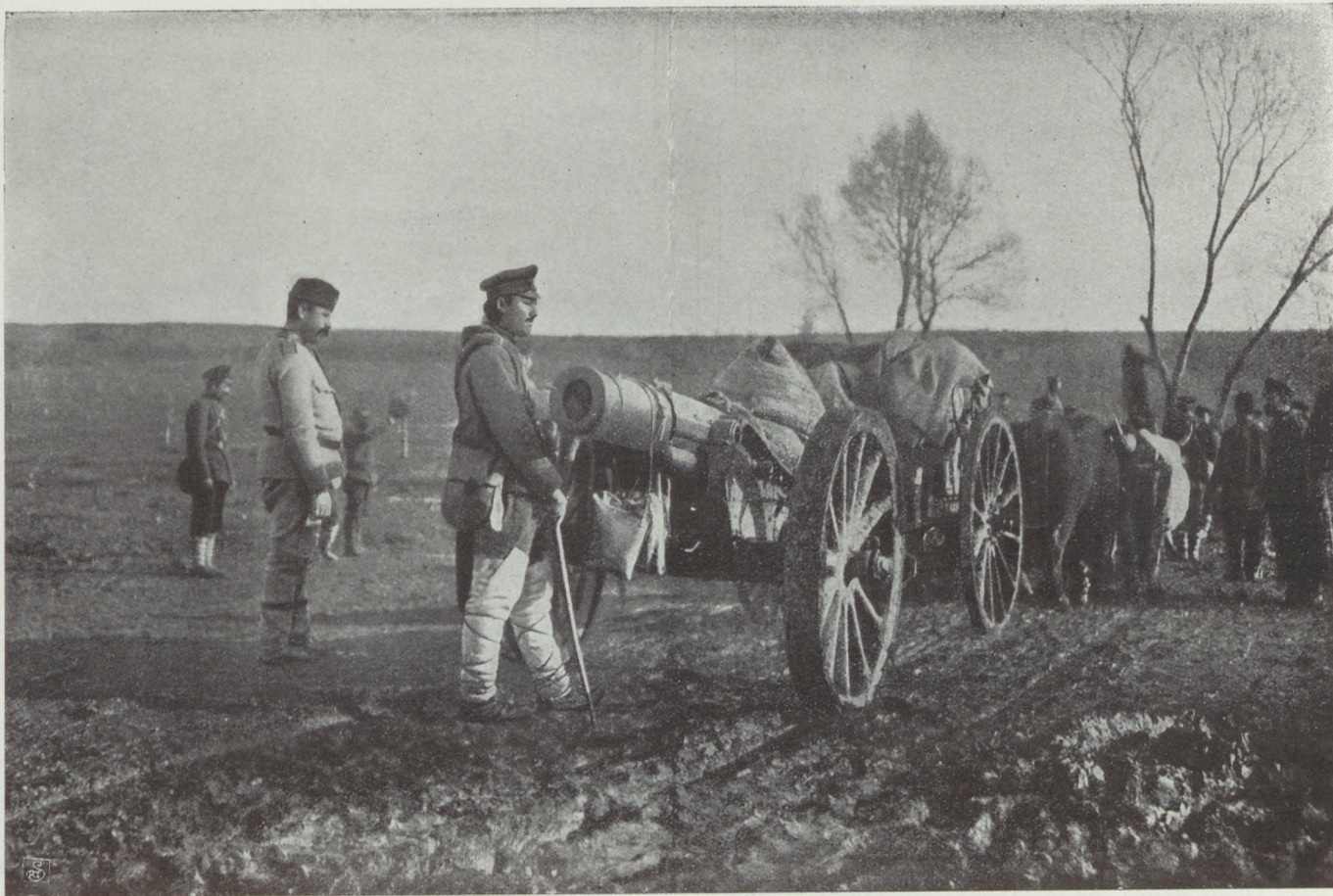
Bolgár ágyuk szállítása szerb területen.