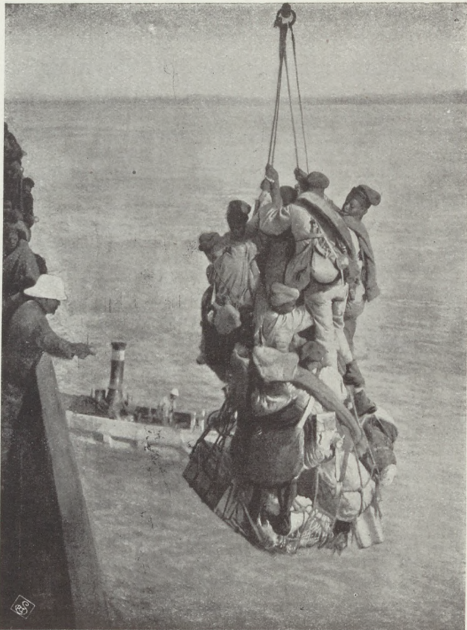
Az entente csapatainak partraszállítása Szalonikiben.