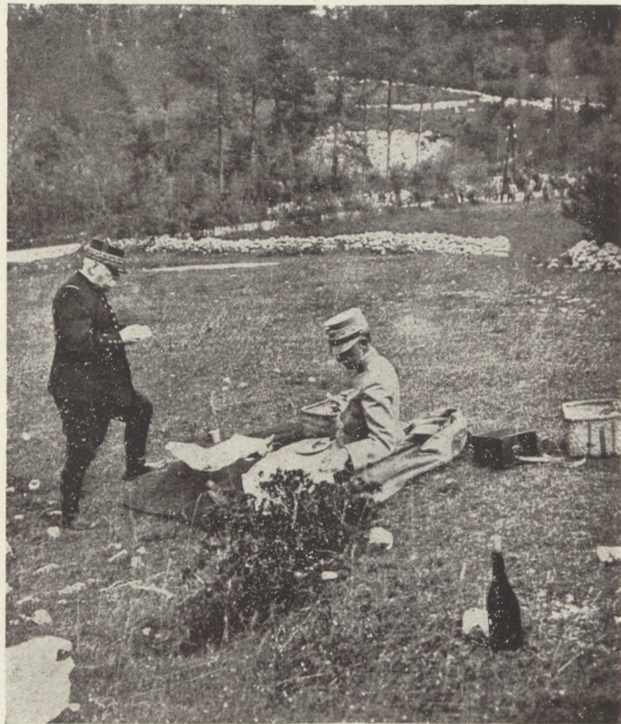
Az olasz hadiszálláson : Joffre és az olasz király reggeliznek.