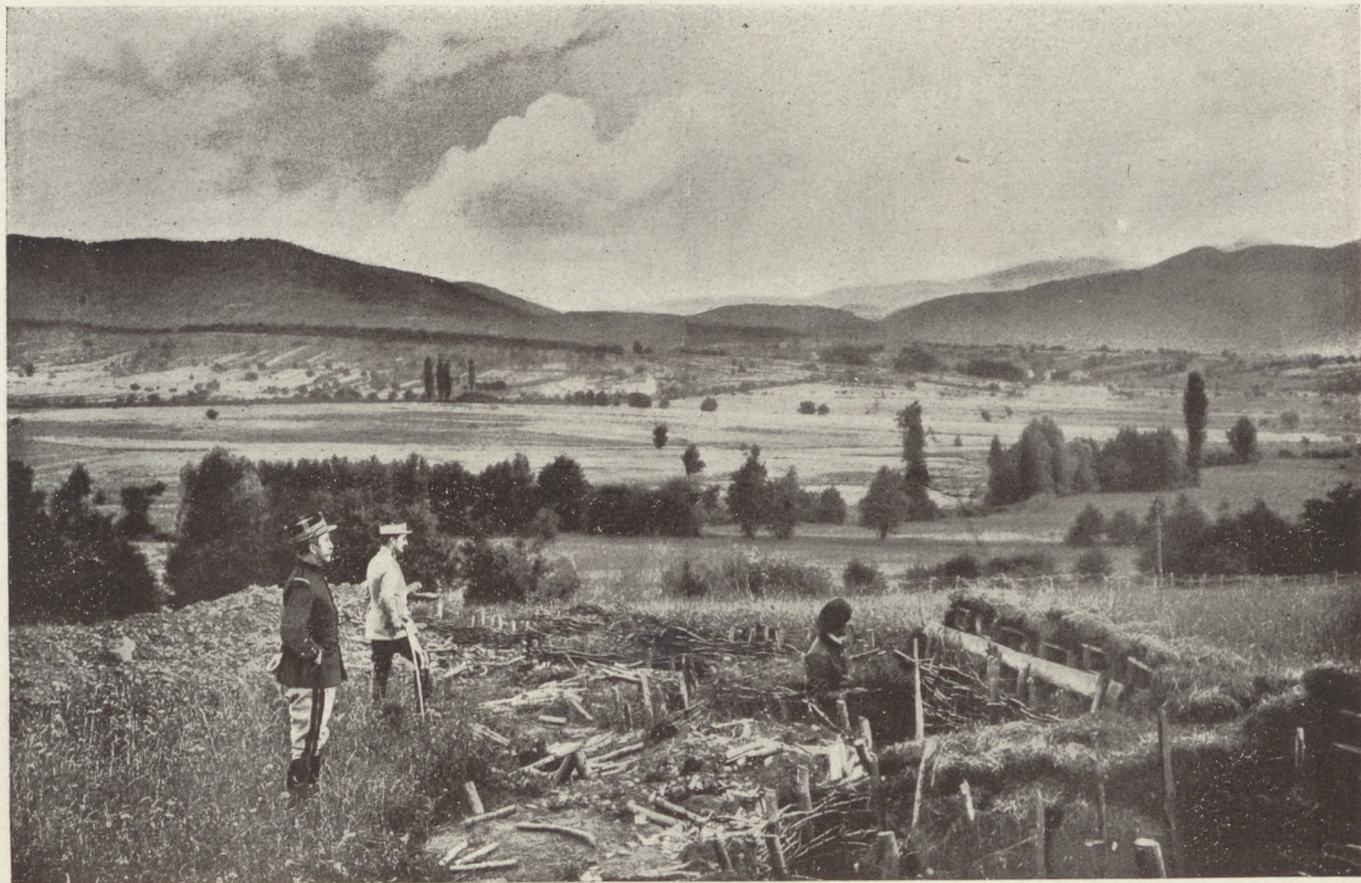
Francia hadállás Elzászban : Németek által összelőtt lövészárkok a Thann völgyében.