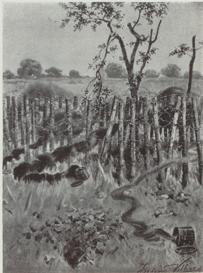
Olaszok által használt gázbombák a délnyugati harctéren.