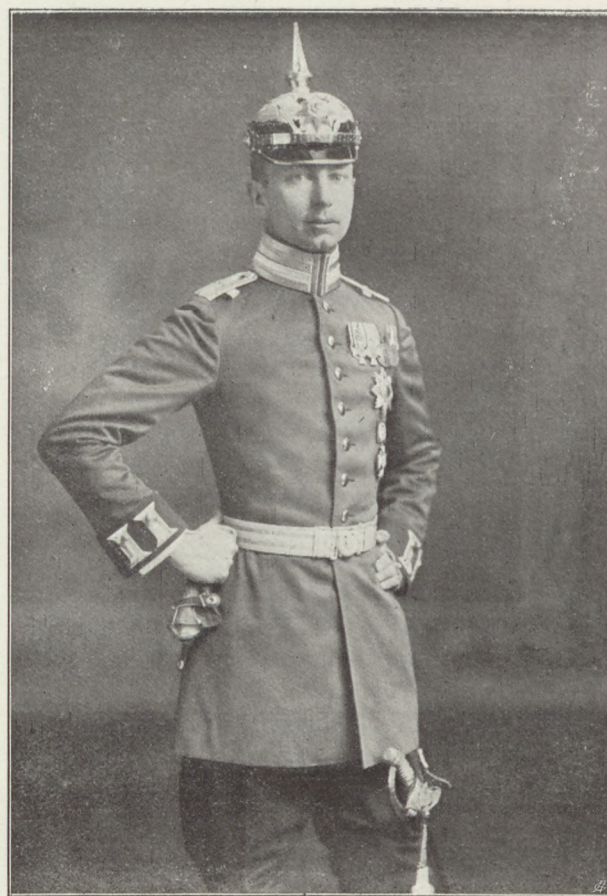
Joachim porosz kir. herceg, a német császár legifjabb fia, a ki most jegyezte el Mária Auguszta anhalti hercegnőt.

A kórus alatt levő padok egyikében egy nyulánk, fiatal nő térdelt a lorétoi Boldogasszony képe előtt.