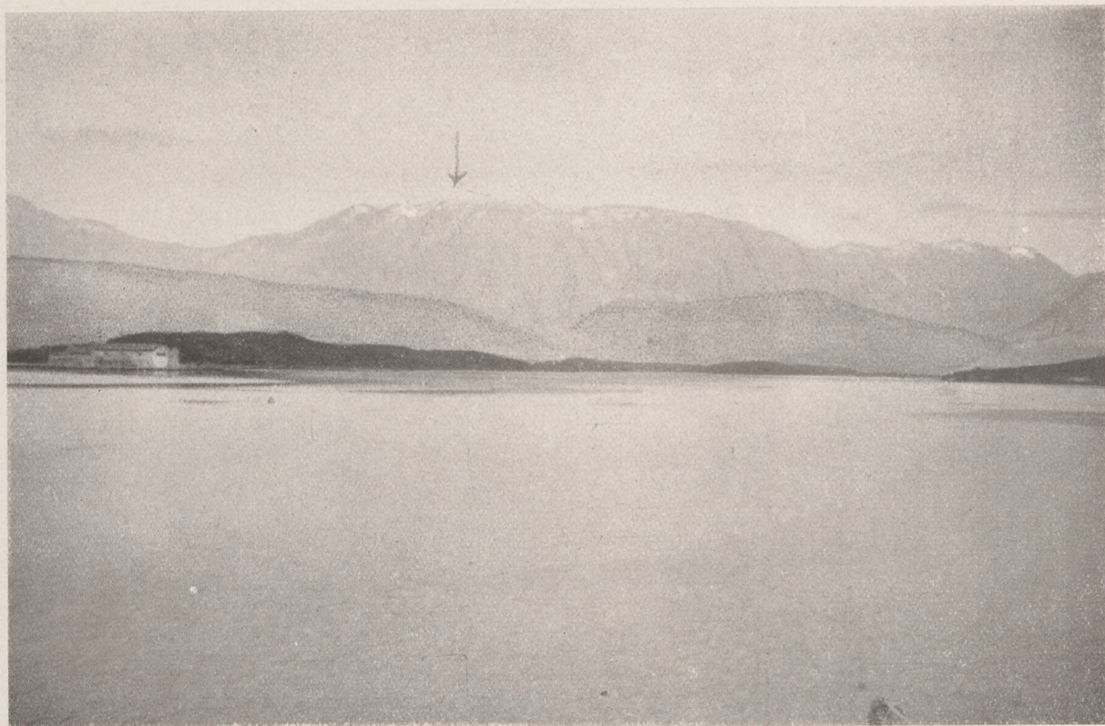
A Lovcen. A nyíllal jelölt helyen intézte hős hadseregünk a sikeres támadást.