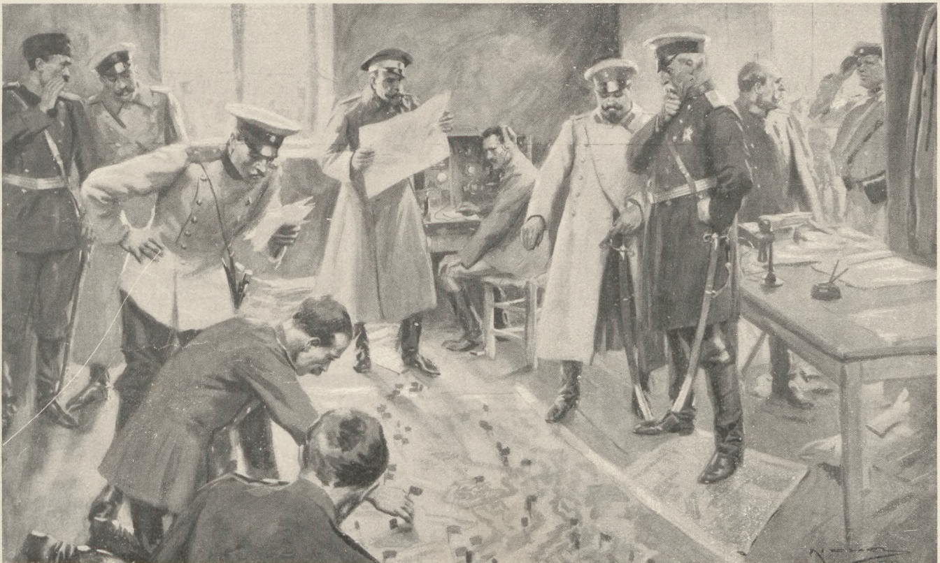
A bolgár főhadiszállás Szaloniki előtt: Fölvonulás a térképen.