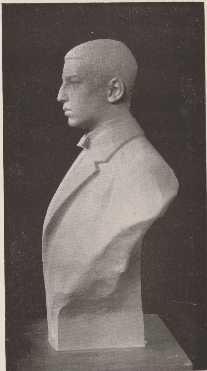
László főherceg. József főherceg kisebbik fiának mellszobra. Mintázta Istók János szobrászművész.

— Még rádüntöd, te mafla! — lökte odébb a