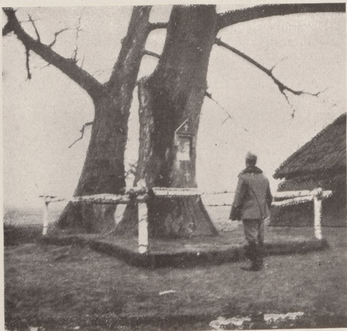
A hős 13-as huszártisztek temetője Dolzycában.