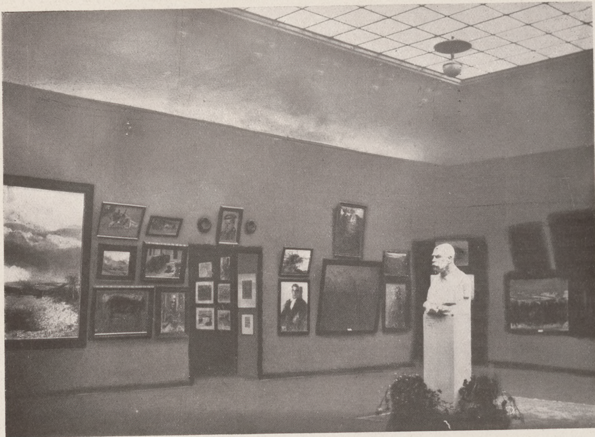
A cs. és kir. sajtóhadiszállás háborus kiállítása a Nemzeti Szalonban: Az első terem, közepén Ő Felségének Ligeti Miklós által mintázott mellszobrával.