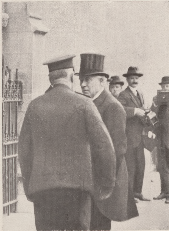
Asquith angol miniszterelnök az általános védkötelezettségi vita reggelén a londoni parlament épülete előtt