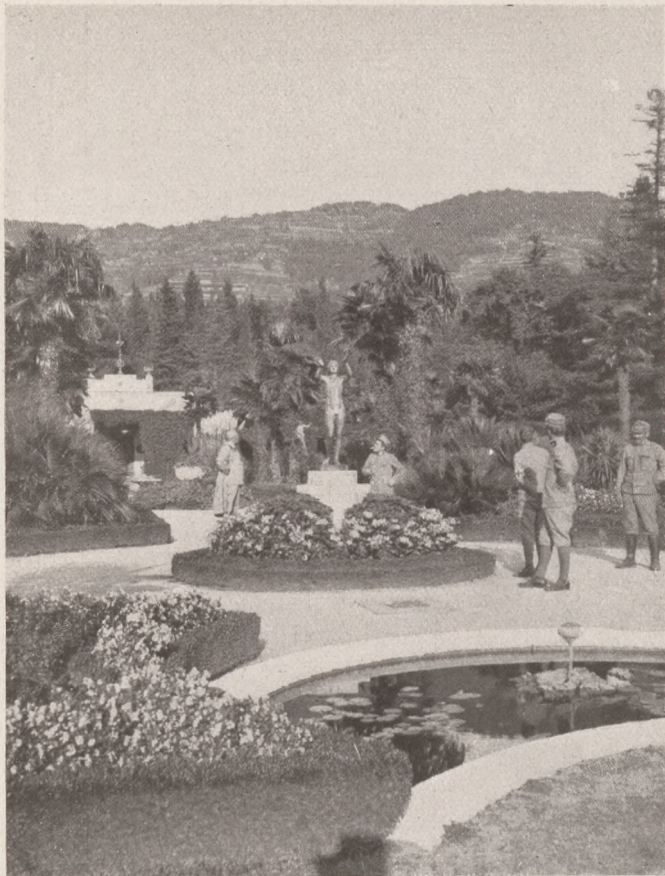
A délnyugati harctérről: Parkrészlet Miramaréból.