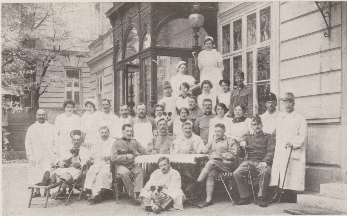
Schratt Katalin bécsi kórháza.