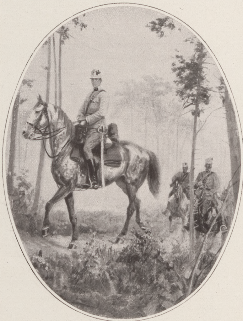
Leo Károly főherceg.

APOLLO a ROYAL-SZÁLLÓ épületében az előkelő társaság mozgóképszínháza.