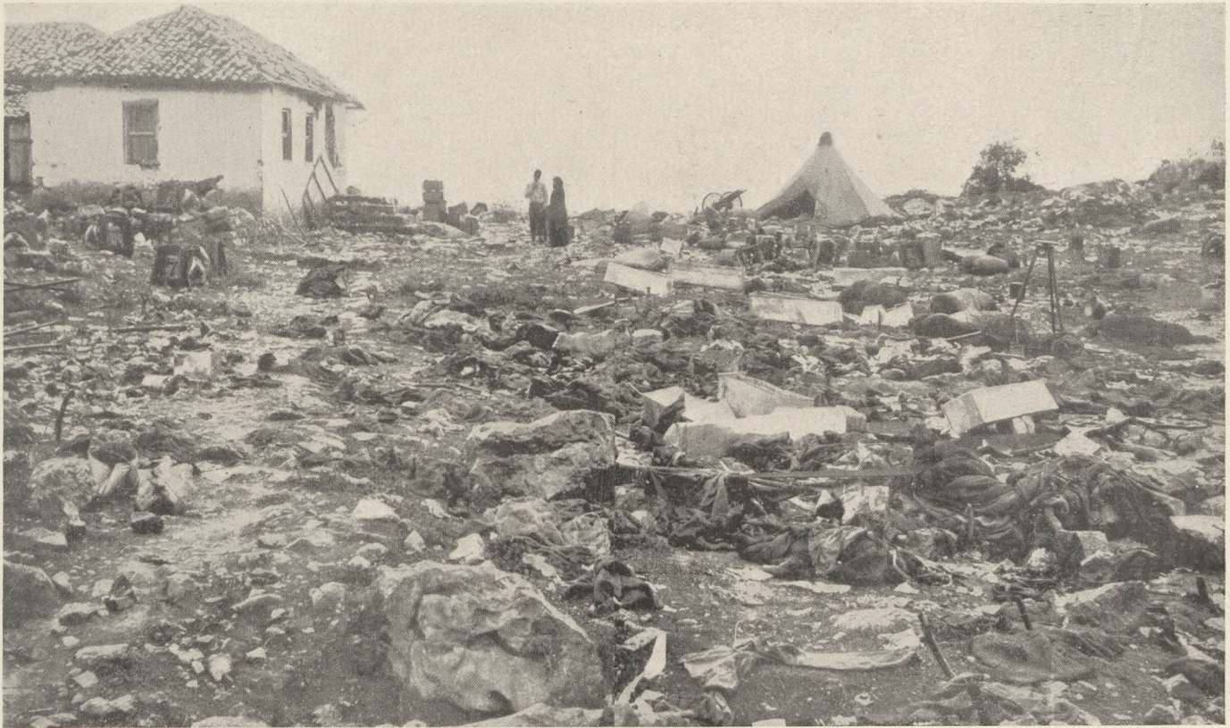
A déli harctérről: Elhagyott csatater egy falu szélén Montenegróban.