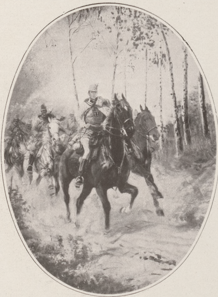
Vilmos Ferenc József főherceg.

Percekre elfelejtem a véres háboru borzalmaikat, a sok emberi nyomoruságot és szenvedést és elképzelem, mily szép lehet egy csöndes, nyugalmas este ebben a kővilágban, a melyet a háboru most ezer és ezer katonával népesített be. És azt álmodom, hogy e kövekre hulló vérrozsák nyomán a diadalmas tavasz szép fehér virágot, a béke virágát teremti meg.