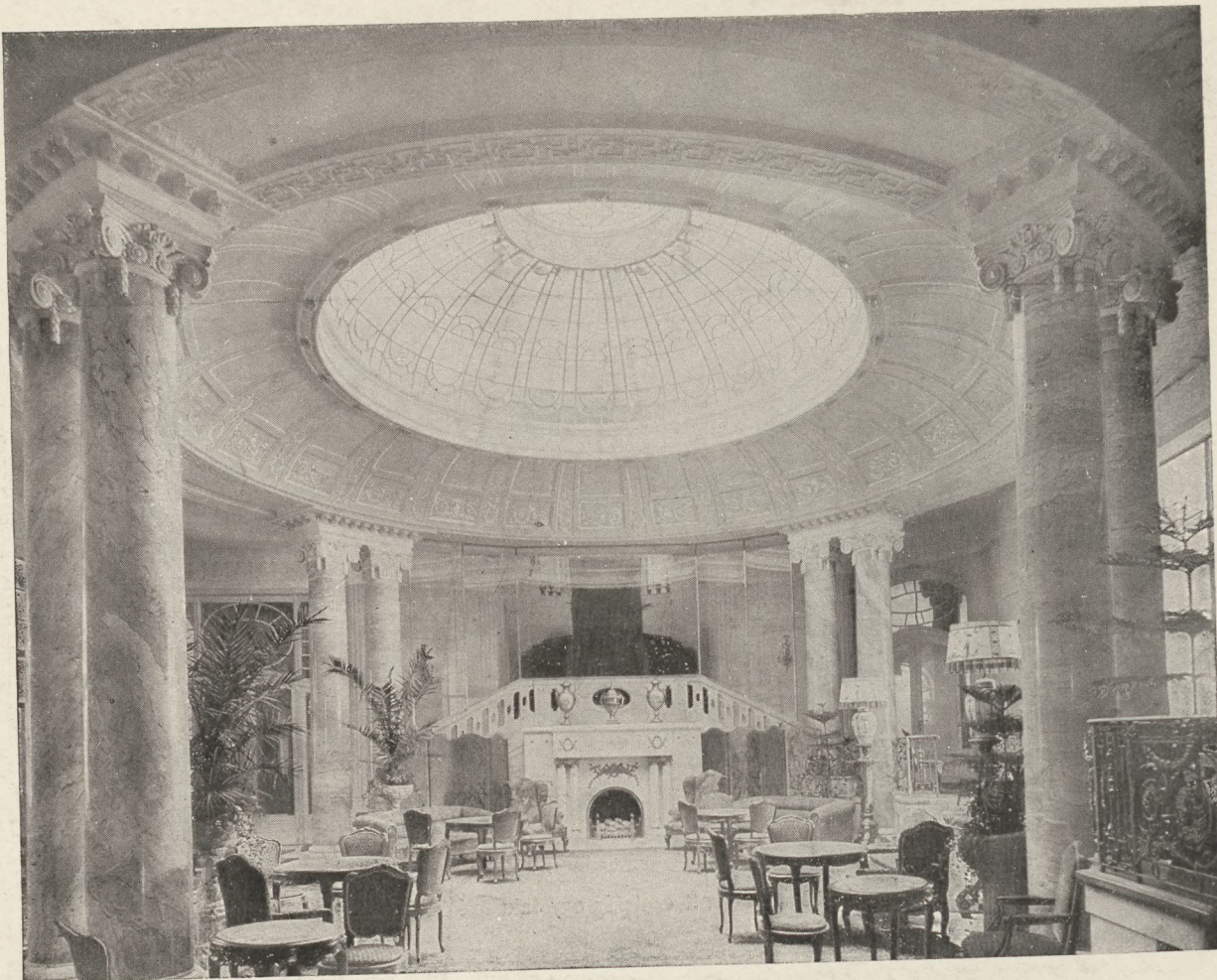
A Ritz az előkelő társaság szállója.