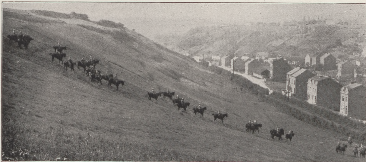
A namuri vadászverseny : Leszállás a völgybe.