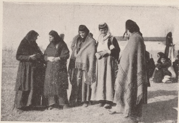
Karauli vásár. Montenegrói asszonyok.

Tengernyi boldogság, tengernyi szenvedés és hosszu évek története belefér egy dióhéjnyi álomba. Minden, a mi szép, fenséges, magasztos és minden, a mi fájhat, minden, a mi szomorú . . .