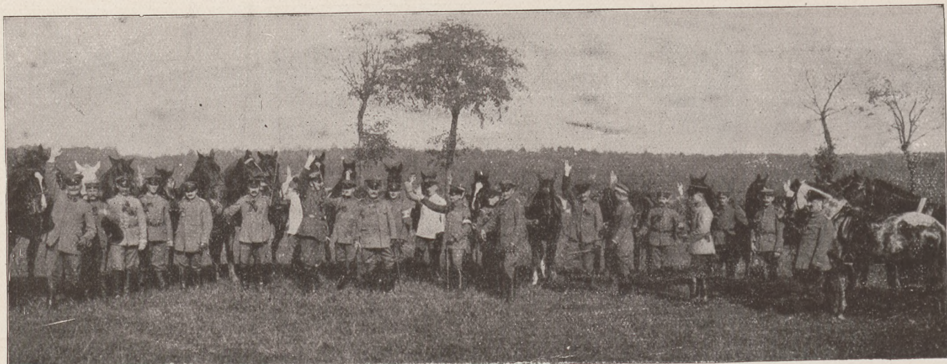
A namuri vadászverseny: Halali.

— A hadnagyoktól kérek majd kölcsön a zsoldfizetésig, — gondolta a százados és szive boldog ámulással érezte, hogy a kora tavaszban milyen édes a bokori rózsaszínű e virág, mint Julia körme és Konstantin szemével most a fehér függőnyt kereste, a mi az orvosék hálójának ablakán... Azután hirtelen valami hang, madárcsipogás ez, vagy megvert szerelem panasza? A kert kapujában egy kis gyermek feküdt, fehér pólyában, arca az éhségtől és a hidegtől halványkék, mint némely vadvirágok színe.