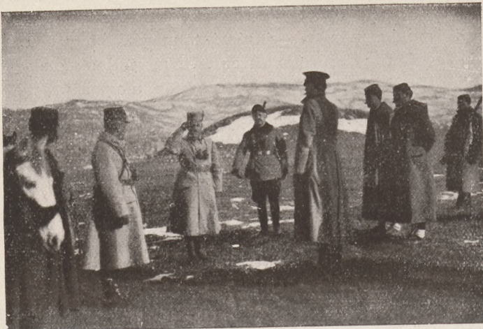
A montenegrói kiküldöttek Astováczt környékén tárgyalnak az osztrák magyar parlamentairekkel a fegyverletételről.