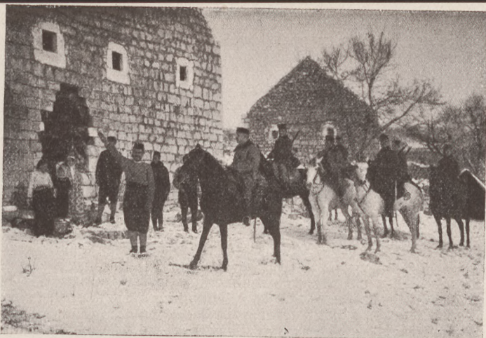
Huszárjárőr Montenegróban. Egy török megmutatja az ellenség menekülésének útját.

Jártam őserdőben, a melyekben még nem tapos-tak nyomot. Városokban, templomokban, a minőket emberkéz nem alkotott.