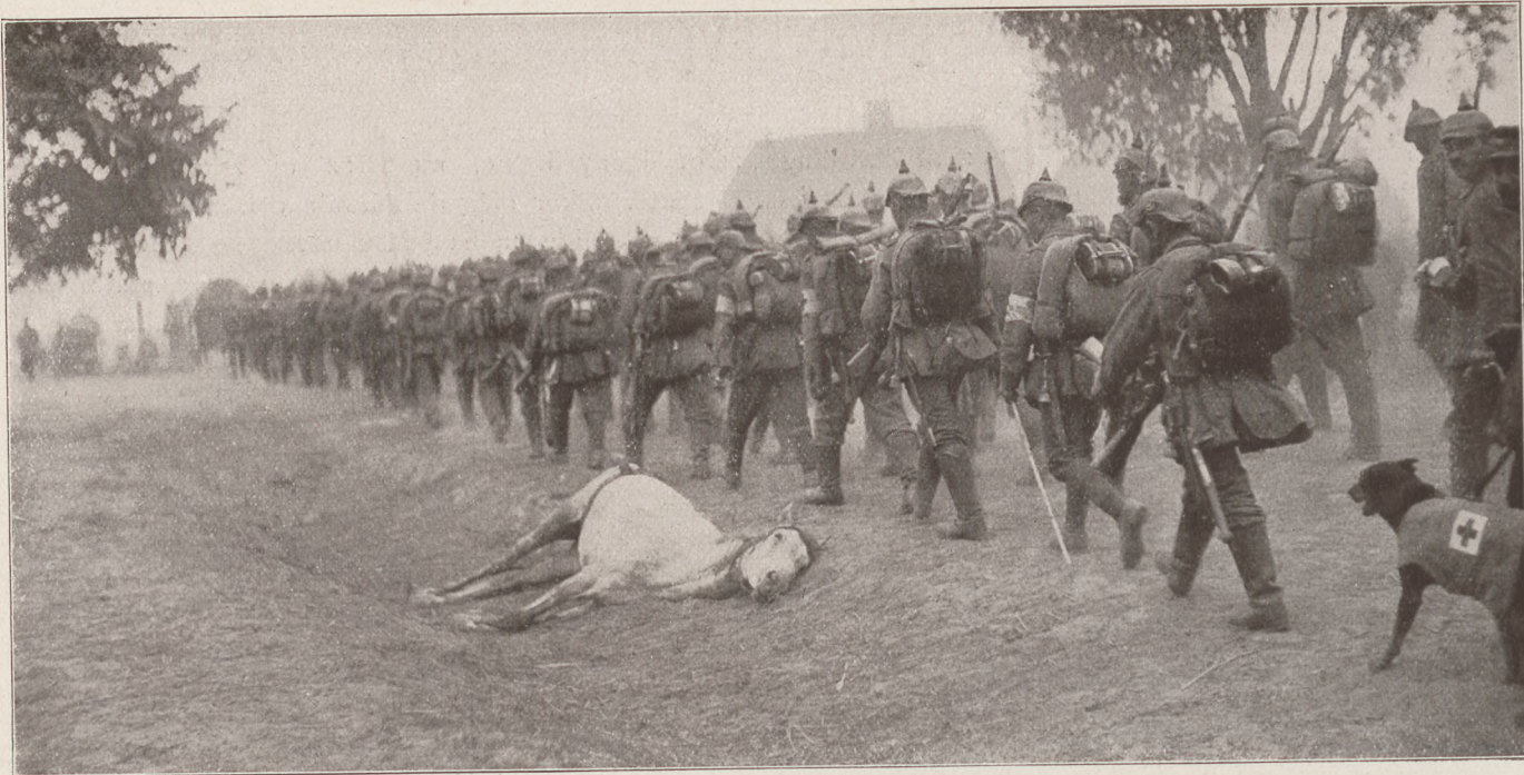
A nyugati harctérről. Német gyalogság a frontra indul.