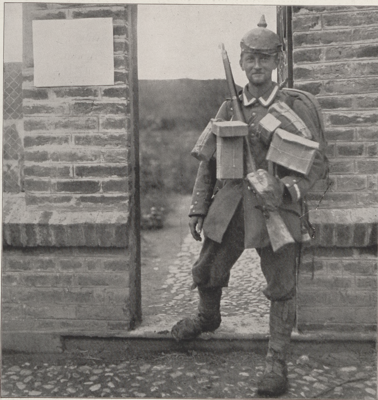
Az északi harctérről : Megrakodva szeretetadományokkal.