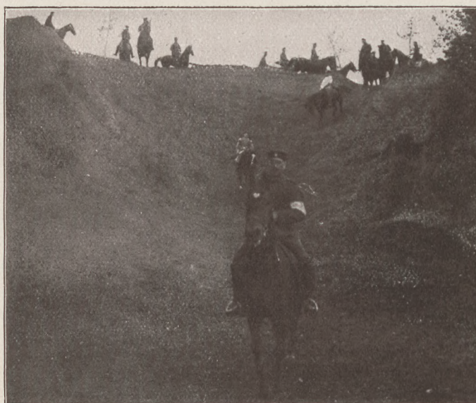
A namuri vadászerenyről: Leszállás a völgybe.