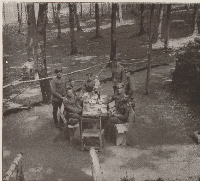
A Vogézekben: Nyugalmas ebéd közvetlenül a front mögött.