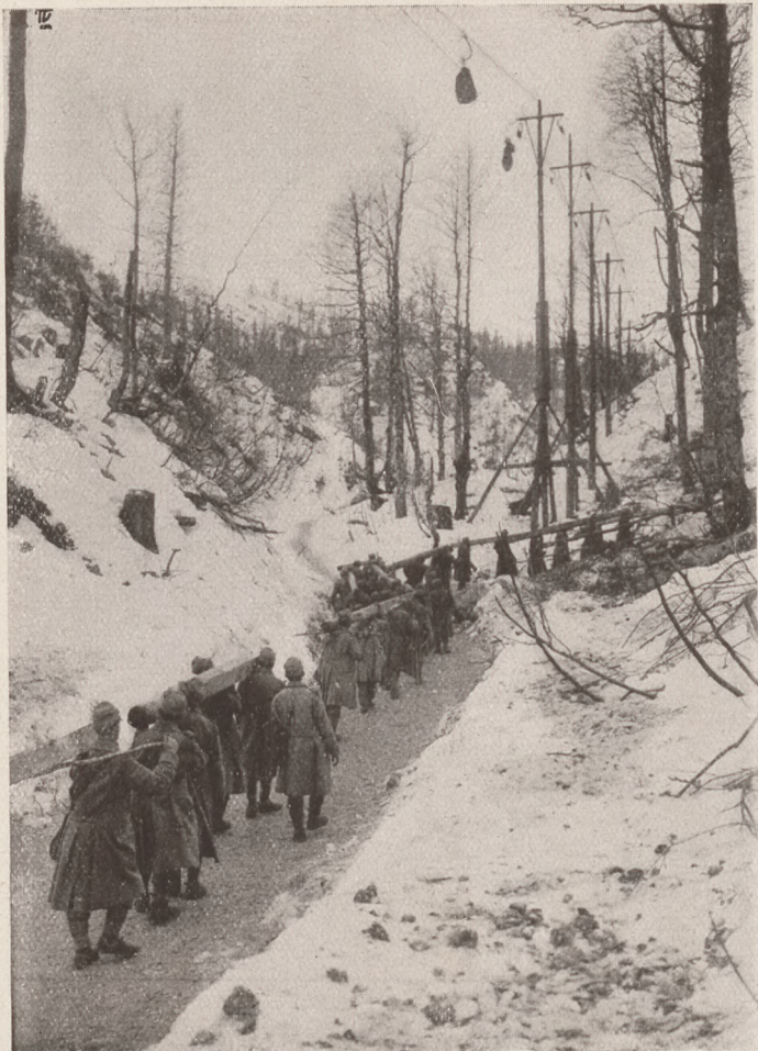
Az olasz harctérről: A menetszázad építő anyagot visz a Krn tetejére. Felül a kötélpálya.