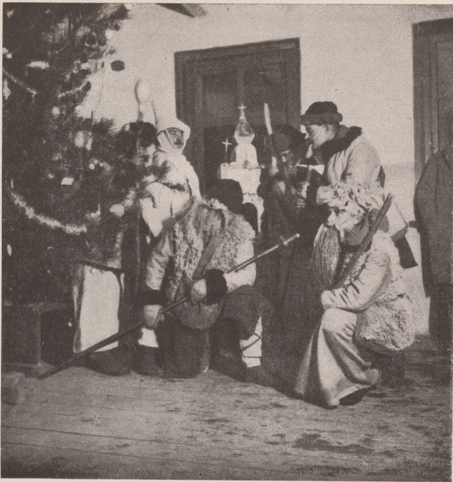
13-as huszárok, mint Betlehemesek az északi harctéren.