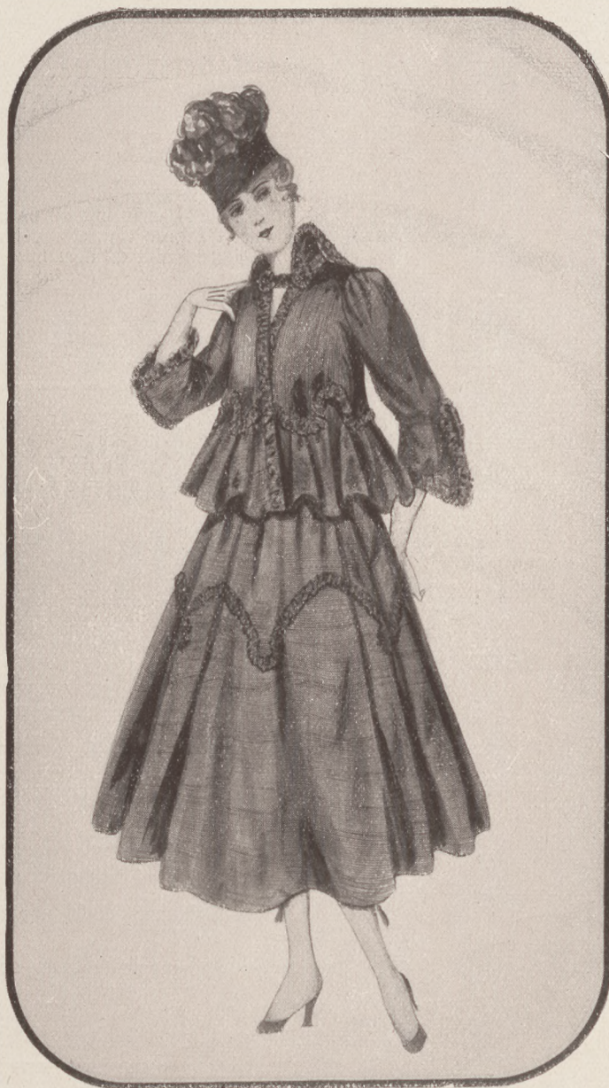
Honi kelméből készült egyszerű ruha.

Eme körülmény nem regisztrálhatom száraz tényként. Ez több ennél, örvendetes jelensége annak, hogy ime mindenütt helyesen fogják fel a mi indokolt divattörekvésünket. Nem pitykés, sallangos falusi divatról van szó. Ezzel csak féltékenykedő ellenlábásaink vélnék kifigurázni bennünket. Minden egyes nemzetnek meg van a maga népies s a maga úri viselete. S ha már arról esik szó, hogy legyünk függetlenek és szabadok, akkor ne legyünk senki- nek divatvazallusai, sem ellenfélnek, sem jóbarátnak. A divatnak van egy rokonvonása a művé-