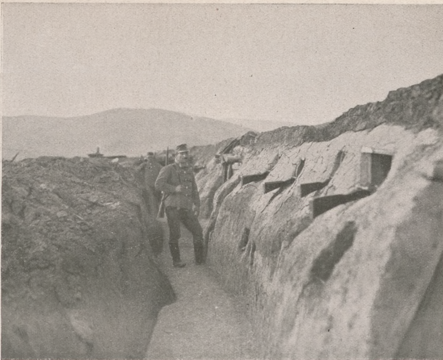
Huszárok a lövészárokban: József főherceg-körut.

De a halott anyjával és a háboru borzalmas végzete folytán talán messzire elragadott atyjával ugyan mi is lehetne belőle? Semmi kétség: idegenek vennék őt magukhoz könyörületből. Szegény kis Sédan!