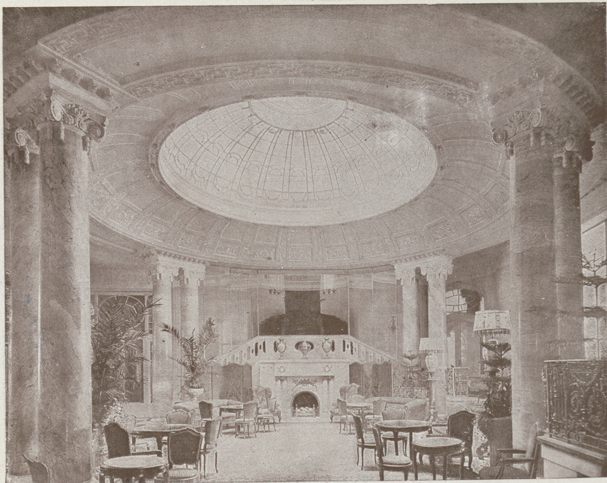
DUNAPALOTA (ezelőtt Ritz) az előkelő társaság szállója.