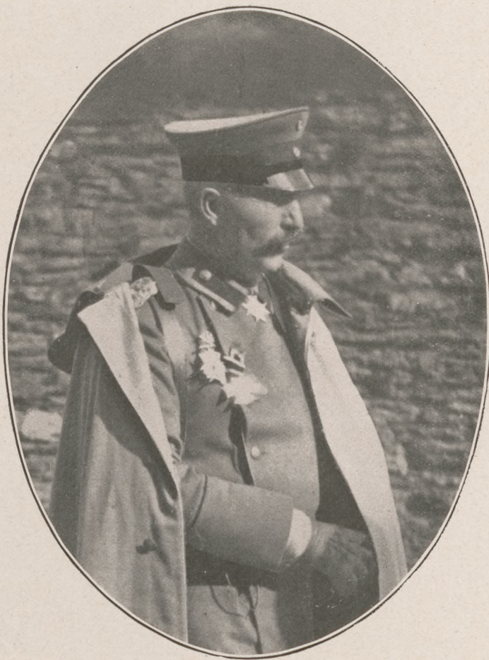
II. Vilmos császár legujabb arcképe.

És multak az idők, folyt a munka; a szó elrepült, a tettek gyökeret vertek és a Kulturkaiser ma a világ-háboru legelső hadura, dönthetetlen tölgye a legnagyobb harcnak, a mit valaha vívtak, de lehetne-e az, ha egy negyedszázadon keresztül nem a kulturának élt volna, ha nem rajongott volna Goetheért, ha nem irt volna