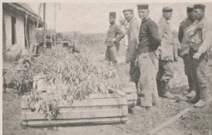
Becsomagolt 30 és feles lövedékek.