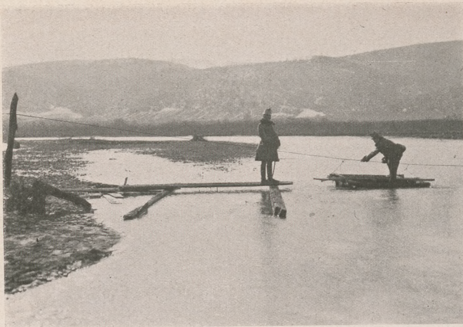
Az északi harctérről: Átkelés a megáradt folyón.