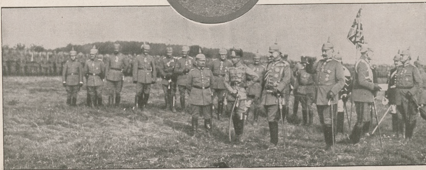
A császár és a trónörökös egy katonai diszszemle alkalmával a Vogézekben.

Ave Caesar! Köszönünk a világháboru harmadik