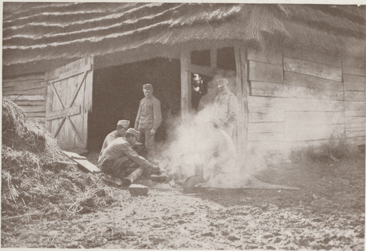
Vilmos huszárok az északi harctéren : Kávéfőzés. Sárdy Tibor huszárkapitány felv.