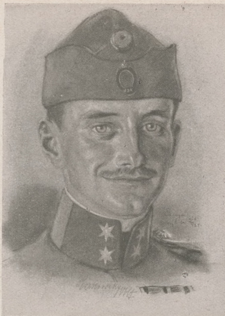
Rakovszky György cs. és kir. 7-es huszárfőhadnagy