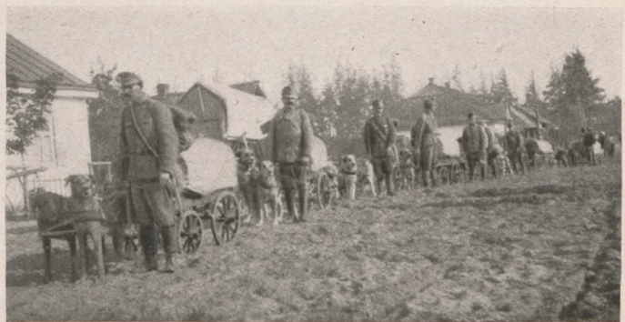
Az északi harctérről: A 66-os hadosztály kutyatrénje.