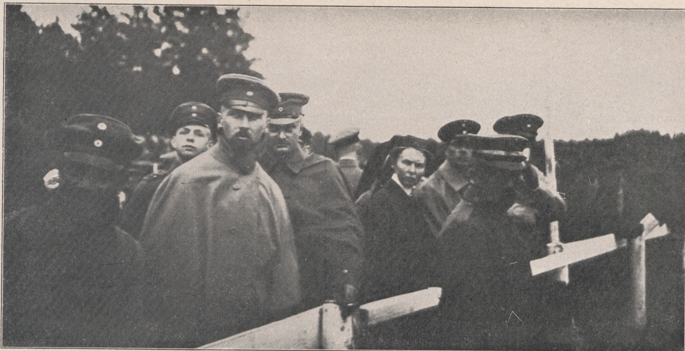
Oszkár porosz kir. herceg egy front mögötti löversenyen.