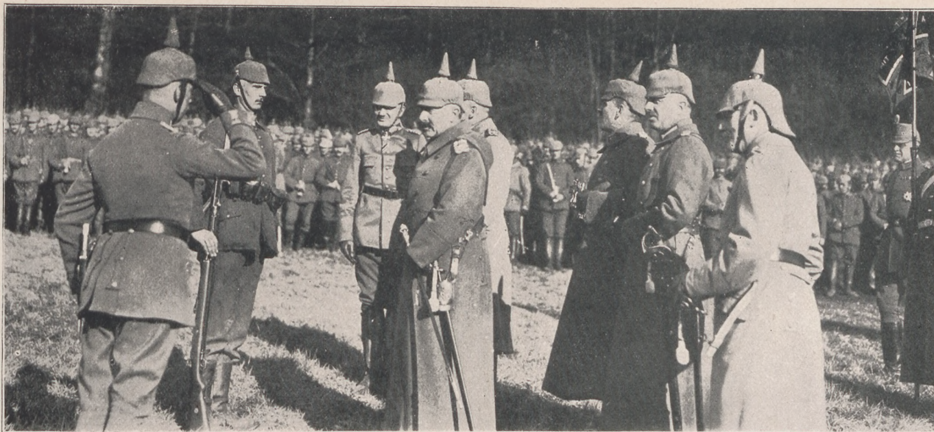
A német császár az északi harctéren személyesen osztja ki hős katonáinak a vaskeresztet.