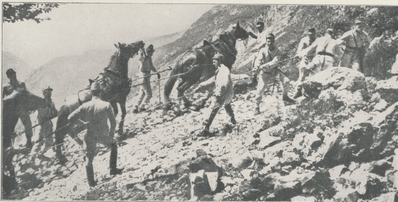
A tíroli Alpokban: Ágyuvontatás a hegyre.