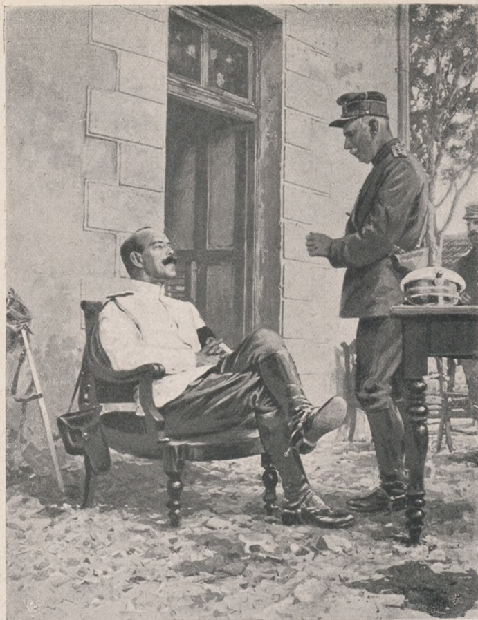
A görög király.