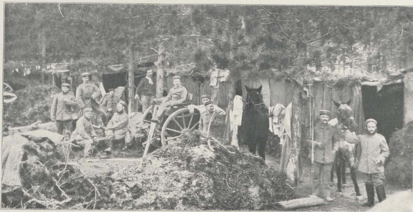
Lóistálló az Argonnokban a front mögött.