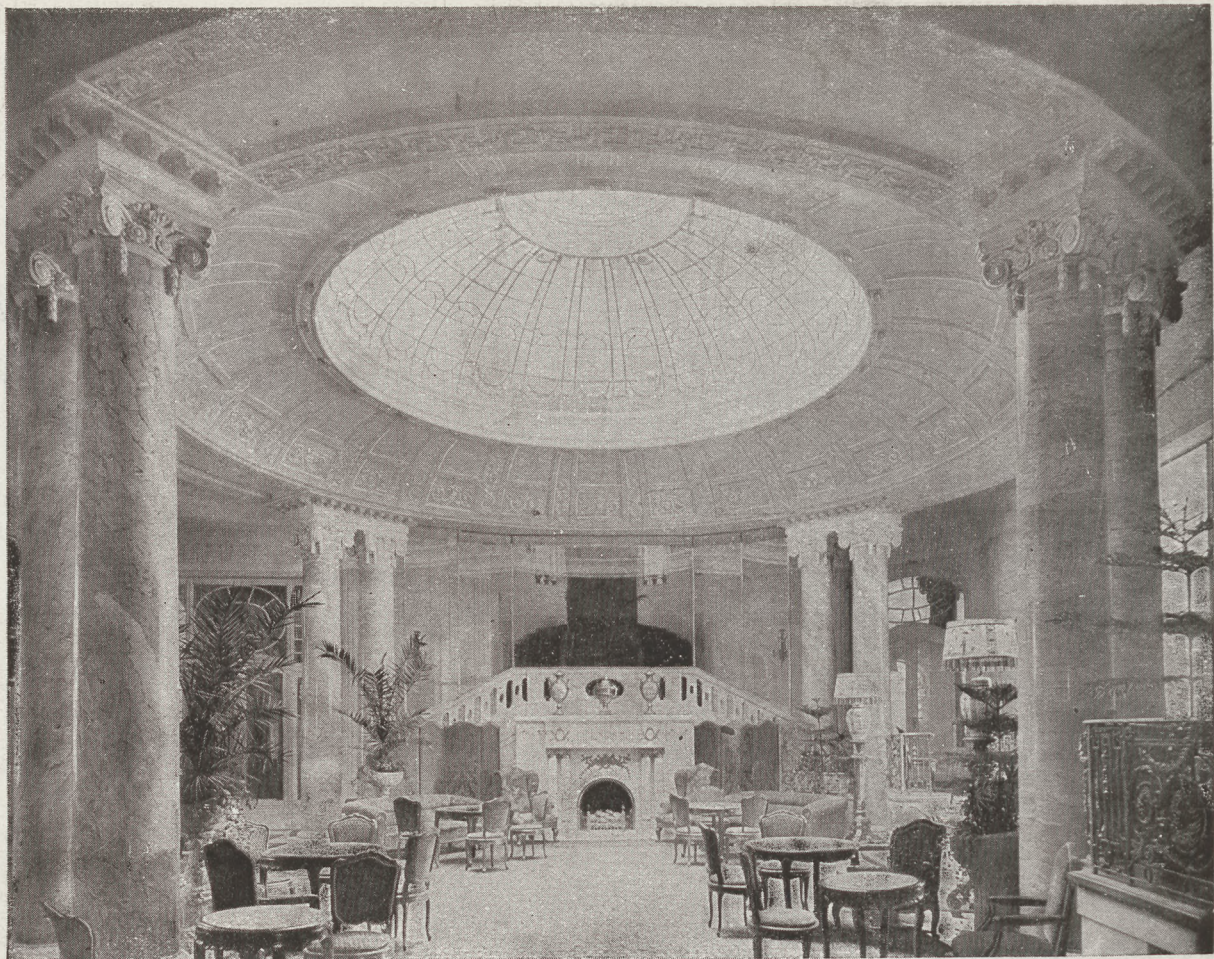
DUNAPALOTA (ezelőtt Ritz) az előkelő társaság szállója.