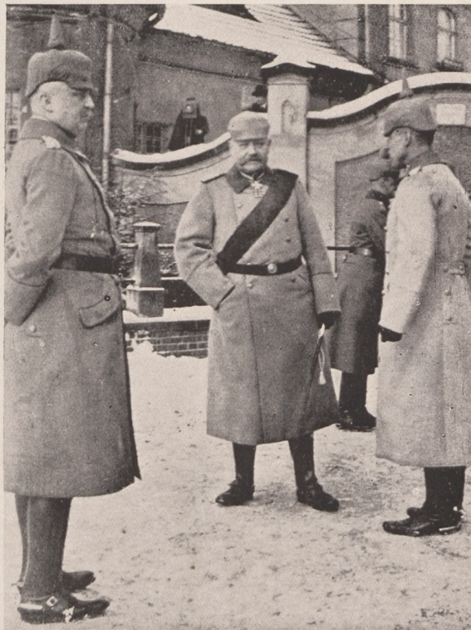
Hindenburg és Ludendorff.