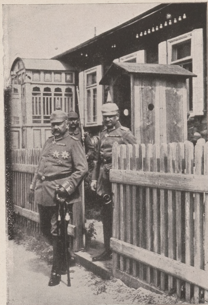
Hindenburg látogatása Linsingen tábornagynál.

Si vis pacem, para bellum. Még látunk pántlikás, virágos lobogókat az utcán, még látjuk a sápadt nyo-