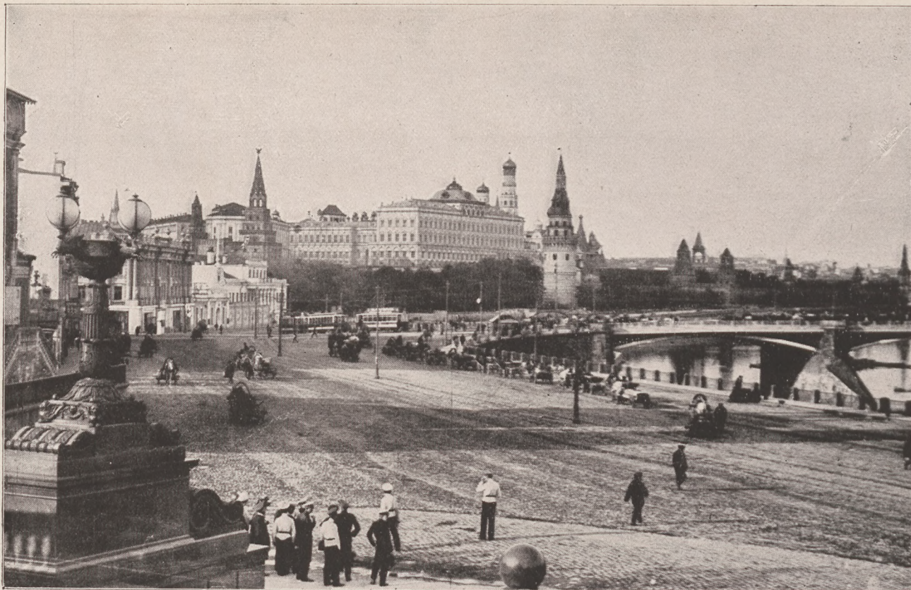
Moszkva, háttérben a Kremllel.

dárhegyek tájáról délre szakadt jövevény leány, aki Beátát a halálba hajszolja, minden, csak nem nő. A vágy, mely megszólal szívében és mint vihar a tengert, kergeti vérét a bűn felé, céljának elérése után, érthetetlenül lanyhul el szenvedelme medrében; — nem az volt a szerelem, — gyónja Rosmernek — hanem ez a lemondó, a pusztá együttéléssel beérő lelki közelség. Gyáva betörő ez a Rebeka Rosmersholmban, aki megijed a legkisebb nesztől és morális tekintetben még alantabb áll, mint a lelkész. A hős pedig egy akarat nélkül való, gyönge báb; mint politikus: mások szócsöve, mint férfi: játékszer a Rebeka kezében.