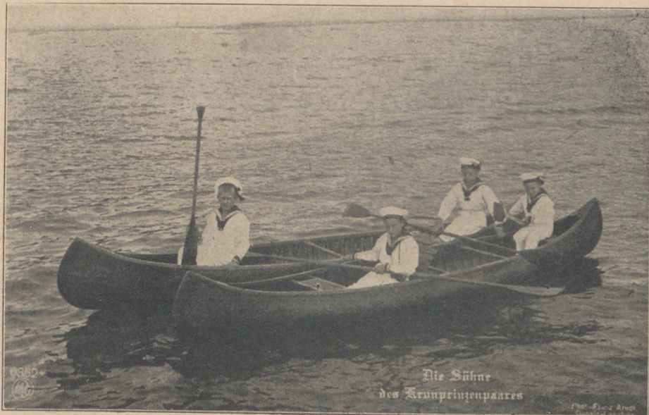
A német trónörökös pár gyermekei.

— Azt hiszem túlzol kissé, de elvégre, ha így áll