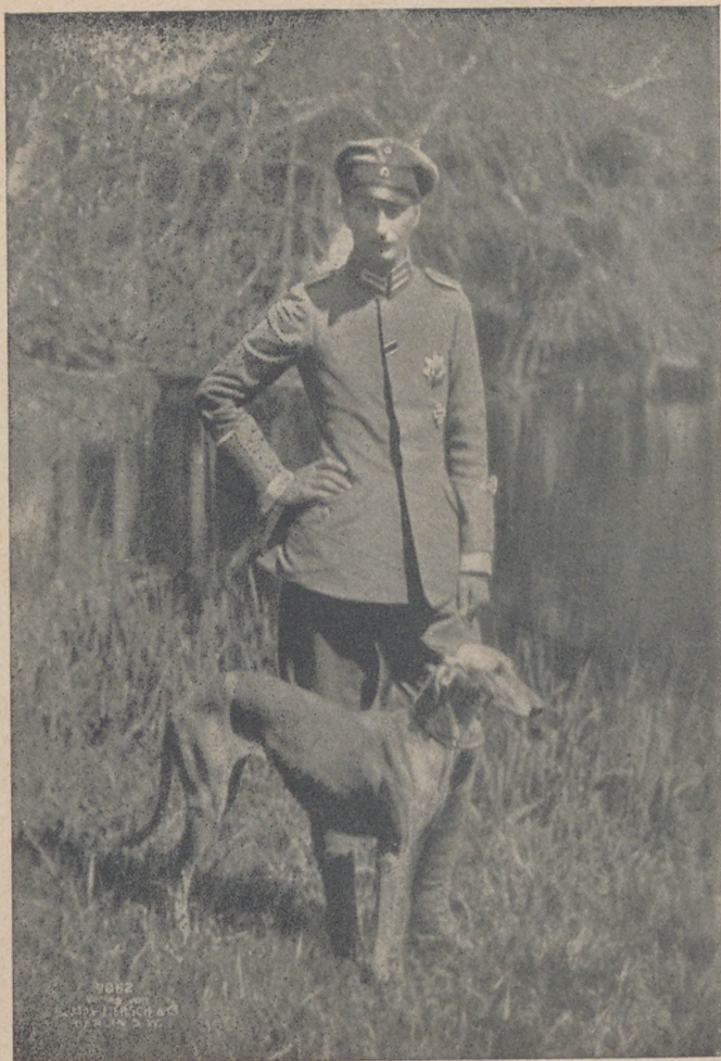
A német trónörökös.