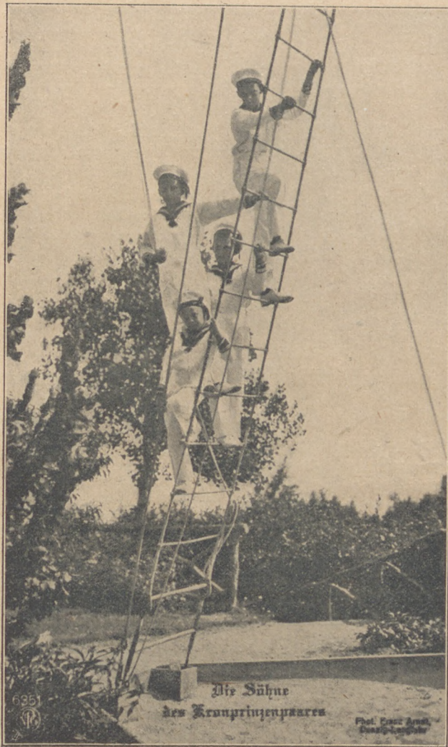
A német trónörökös pár gyermekei.