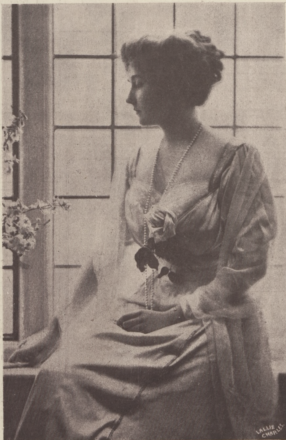
Patricia, connaughti hercegnő.