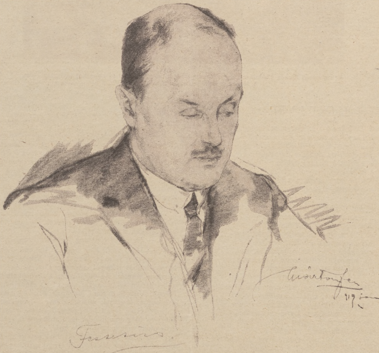
Márton Ferenc festőművésznek „A Társaság” részére készített rajza.