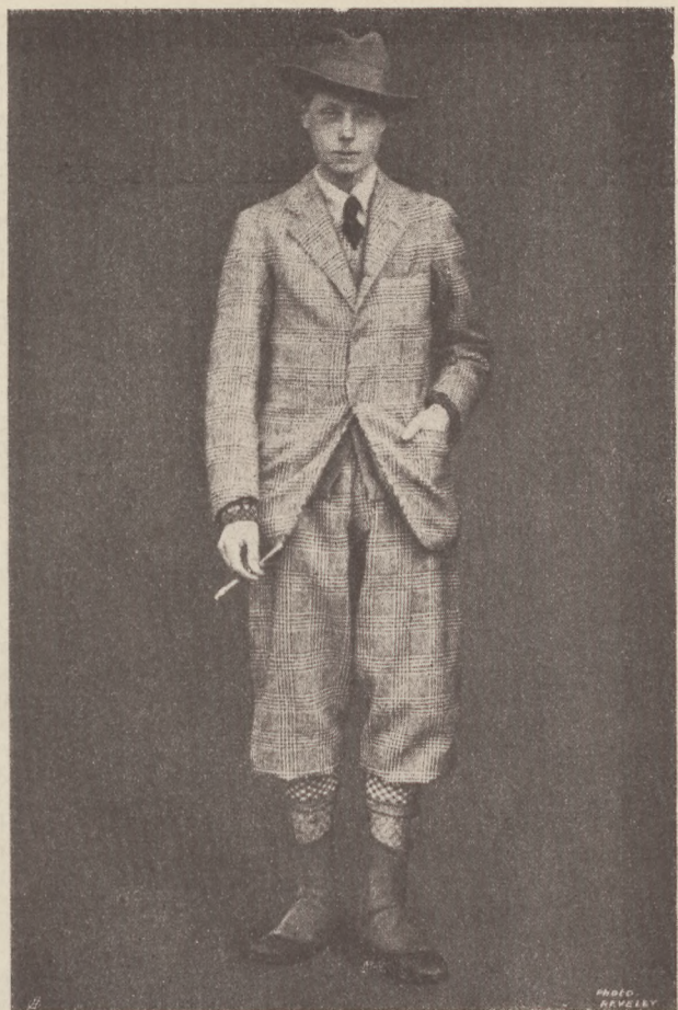
A walesi herceg.