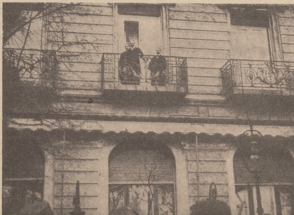
Coolidge professzor, az amerikai birtóság vezetője beszédet mond a tüntető budapesti iffusághoz a Dunapalota szálloda erkélyéről.

— Egy esztendeig olyan becsületes voltam én, Katóka, hogy utcai Cato Rinaldo Rinaldini volt hozzám képest. Akkor tudniillik gyomorhurutban szenvedtem. Alig birtam valamit enni. De aztán megint ki-gyógyultam, — adjó gyomorhurut, adjó becsület! Jelenleg éppen ellenkezőleg: gyomortágulásban szenvedek. Azért is csaptak el a filmgyárból! (Folytatjuk).