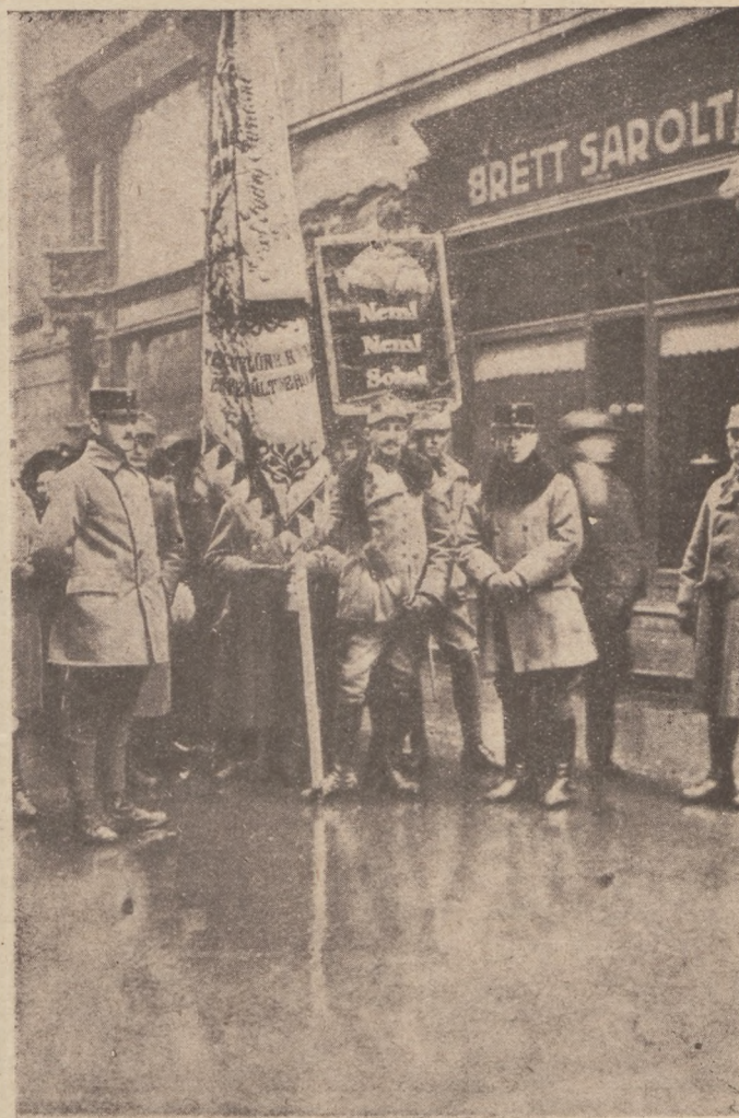
A budapesti tüntető körmenet vezetői zászlóval és propaganda-plakáttal.