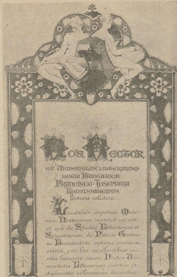
A kolozsvári egyetem diszdoktori oklevele, melyet már nem tudtak átadni József főhercegnek, mert a románok kezébe került. Gyenes Lajos festménye.

Gondos és lelkiismeretes kezelés mellett készít angol és német gyártmányú műfogakat, amerikai kaucsukba foglalva, új rendszer szerint darabját 100 koronáért, 22 karátos arany koronakupakot darabját 600 koronáért, cementplombákat 80 koronáért, ezüstplombákat 100 koronáért, porcelánplombákat 150 koronáért stb. FENYVESSIMENYHÉRT , áll. kép. fogász intézetében, Budapest, IX., Ráday-utca 5, Calvin-tér mellett. — Tel.: József 111-48. Nyitva reggel 9-től este 6-ig. Prospektust díjmentesen küldök.