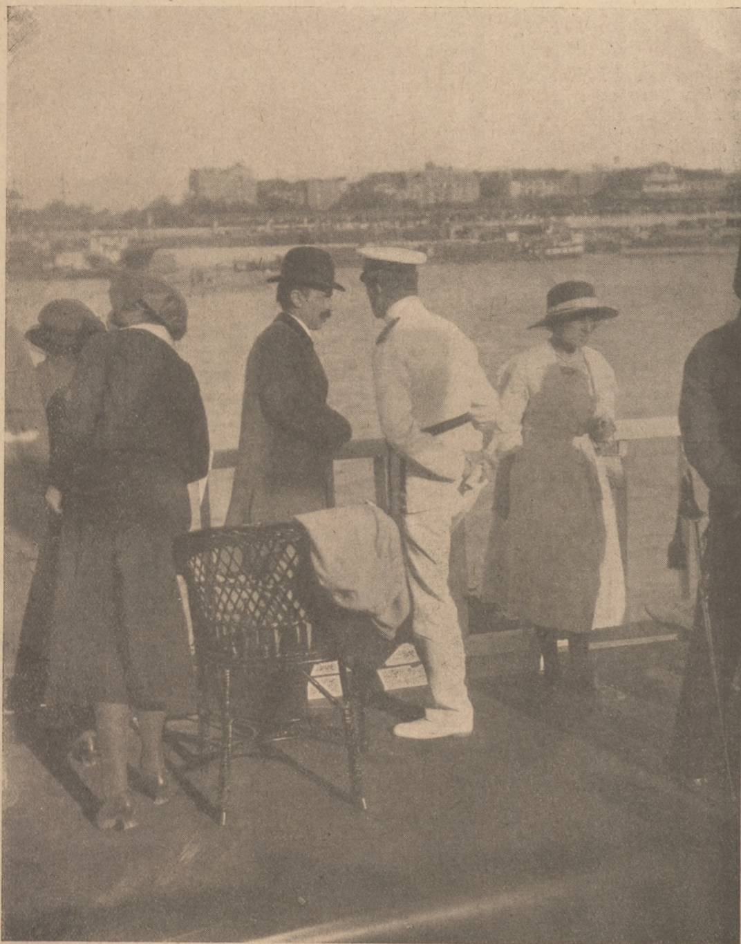
Horthy Miklós kormányzó és gróf Bethlen István miniszterelnök a Hungária csónakház teraszáról a Királyi Magyar Automobil Club motorcsónakversenyét nézik.

Szerkesztőség és kiadóhivatal: Budapest, IV., Múzeum-körút 1. IV. em. Telefon: József 55—40. Hivatalos órák 10—1-ig.