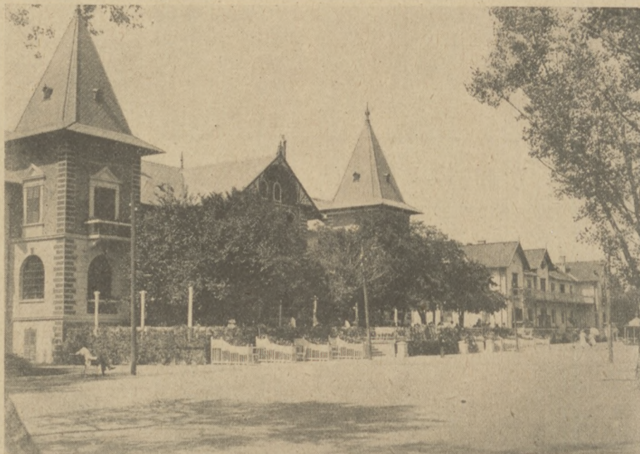
Az Égisz r.-t. Hullám és Balaton szállodái a keszthelyi parton.