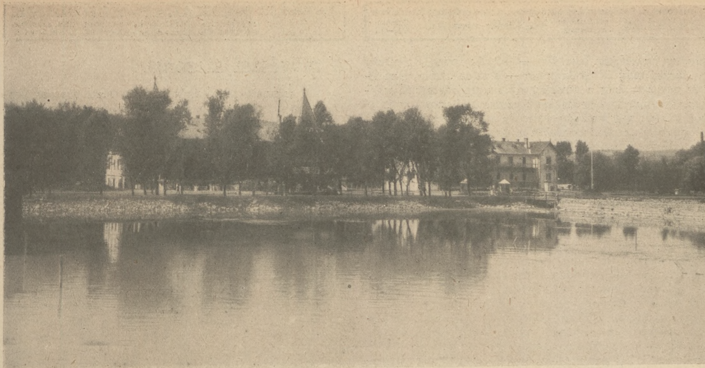
Á a keszthelyi park a Hullám- és Balaton-szállodákkal.