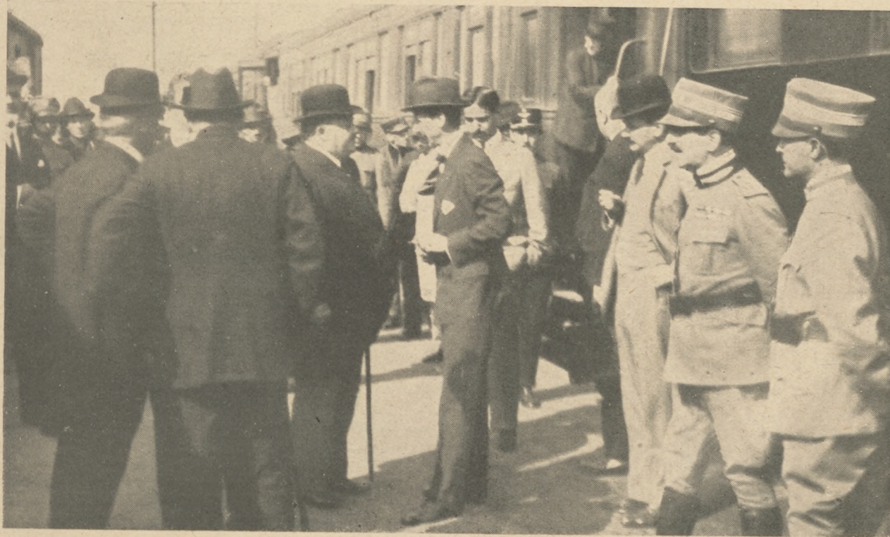
A velencei tárgyalásokról: gróf Béthlen Istvánnak és kíséretének elutazása a velencei pályaudvarról.