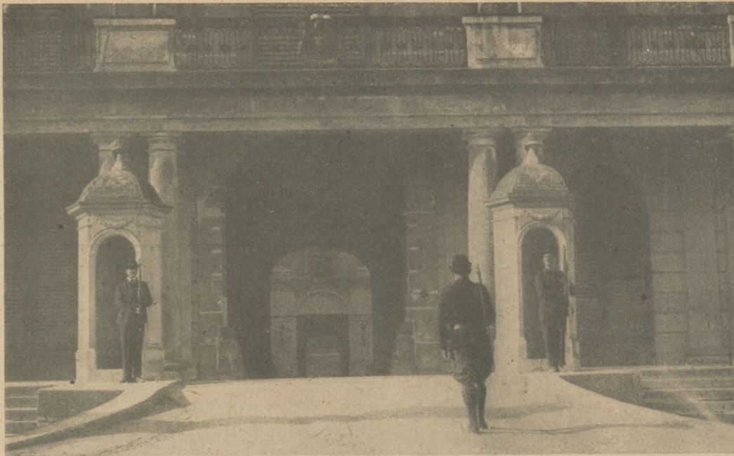
Nyugatmagyarország nehéz napjaiból: A kismartoni herceg Esterházy-kastély a nyugatmagyarországi felkelők őrzete alatt.