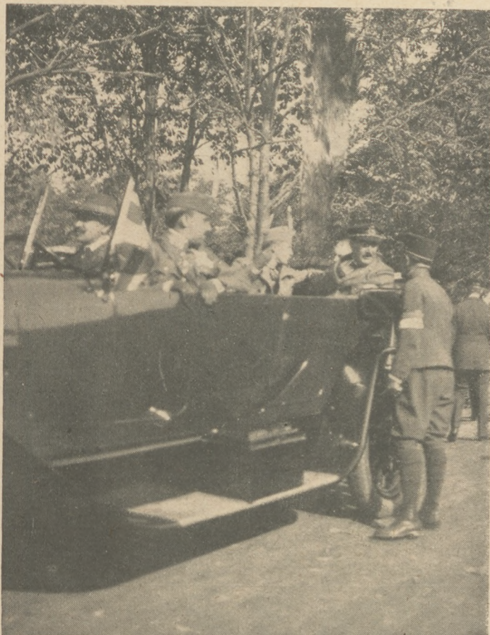
A Királyi Magyar Automobil Club svábhegyi versenyéről: József Ferenc főherceg Szelnár Aladárnak, az Automobil Club vezértitkárának kíséretében.

Táncos Esték. Október hó 19., 26., november hó 2., 9., 16., 23., 30., december 7. és 14-én, vagyis minden szerdán délután 6 órától 12 óráig a Szt. Gellért-szálló télikertjében az egyetemi diákintézmények javára teljesen zártkörű Táncos Estéket rendeznek. Jegyek csak meghívó előmutatása mellett válthatók a helyszínén