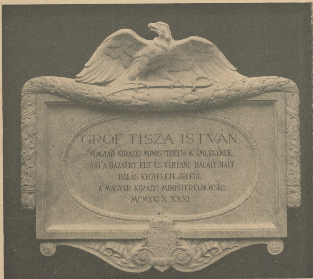
Gróf Tisza István emléktáblája a miniszterelnökség budai palotájában. Kisfaludi Strobl Zsigmond szoborműve.

Szerkesztőség és kiadóhivatal: Budapest, IV., Múzeum-körút 1. IV. em. Telefon: József 55-40. Hivatalos órák 10-1-ig.