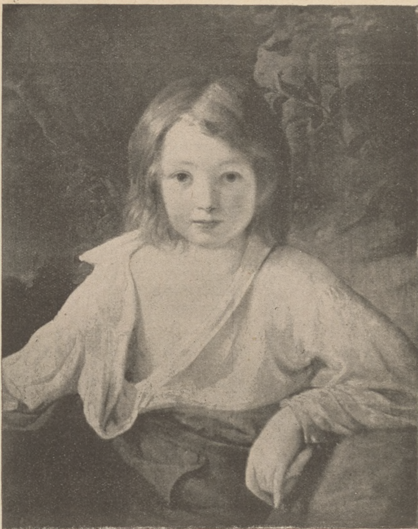
Az Ernszt-muzeum aukció-kiállításáról: gróf Károlyi Gábor ifjúkori képmása. Amerling Frigyes olajfestménye.

Perczel Miklós és felesége május 6-án tavaszi teára láttak vendégül nagyszámú társaságot Koronahercegutcai otthonukban.