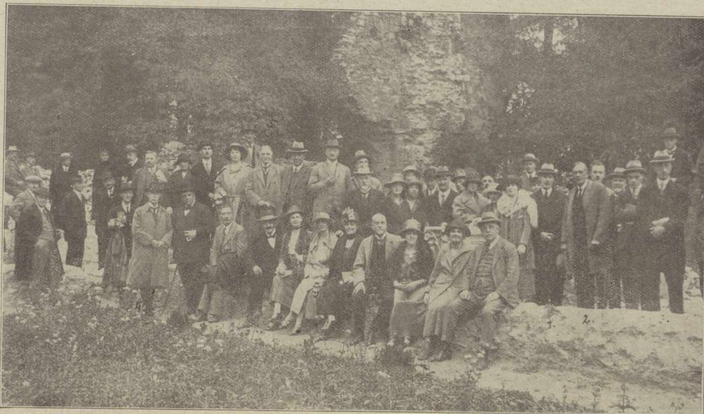
Az angol városépítő tanács tagjainak látogatása Budapesten. Az angol vendégek a Margitszigeten.

— No, most képzeljék el, uraim és hölgyeim, — folytatta a herceg, majdnem kedélyes hangon, — hogy