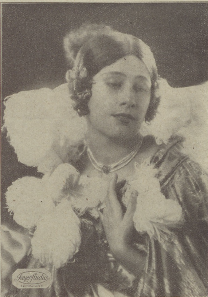
Honthy Hanna, mint Elssler Fanny Faragó Jenő és Nádor Mihály operettjében.