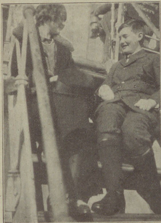
Backfisch-flirt a „Laconia“ fedélzetén.

A hajóóriást Smith kapitány vezette. A kapitány nyugdíjba vonulása előtt kitüntetésképen részesült még abban a megtiszteltetésben, hogy az utolsó kapitányi szereplésül az első útjára induló Titanic ot vezethette.