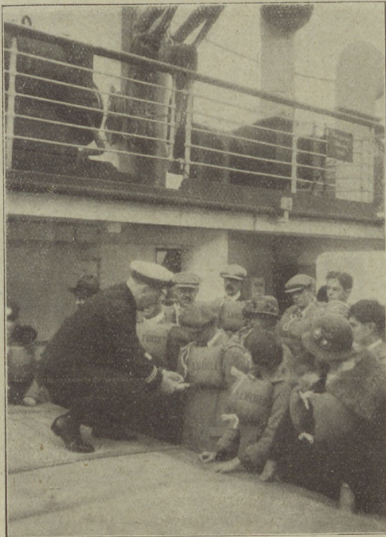
Az életmentő övek kiosztása és használati oktatás a Laconia fedélzetén.