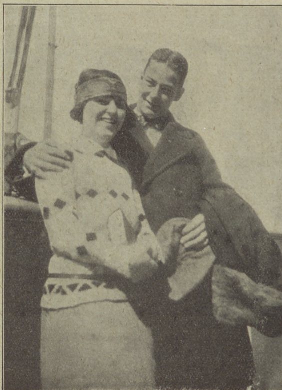
Flirt a „Laconia” fedélzetén.

Nagy csomó amerikai diák és diáklány is utazik a hajón. A vakációt Európában — Páris, London, Olaszország, Svájc, nem kis részben Németországban töltötték, szeptember van, sietnek haza: Harvard, Princeton, Yale, Stanford, Columbia egyetemek kapui nyílnak, kezdődik a tanév, vége a könnyű nyári életnek, kezdődik a komoly munka. Mert tévedés, hogy az amerikai diák keveset tanul és csak sportol, a komolyan gondolkozóknak itt is erős munkát kell végezniök, nagy anyaggal megbirkózniök. Egy ügyvédi pályára készülő diáknak például, miután az egyetemet elvégezte, még négy új évet kell olyan egyetemen töltenie, amelyen ügyvédi vizsgára tanulhat. Ezen vizsgák letétele után