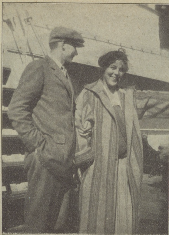
Flirt a „Laconia” fedélzetén.