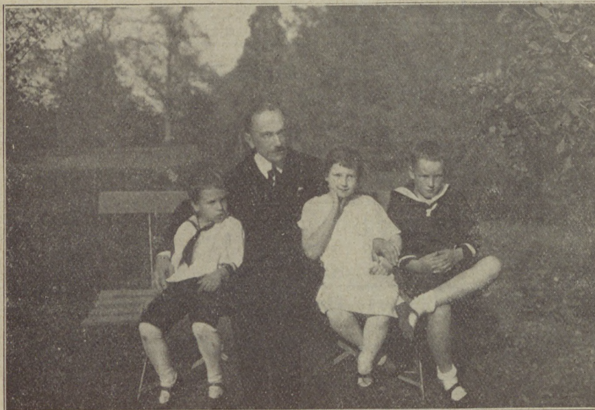
Rakovszky Iván belügyminiszter a három Tisza-unokával a geszti parkban.