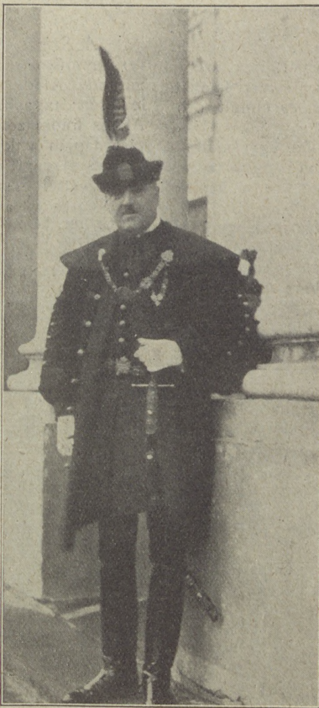
Belítska Sándor, a varsói új magyar követ.

— Tudom, tudom!... Mindenesetre inkább én tartozom köszönettel neked, mert megszabadítottál attól a kínos érzéstől, hogy tönkretettem valakinek az életét... Veleld boldog leszel, meglátod. Csak ezt akartam megmondani neked... Éljen boldogan!