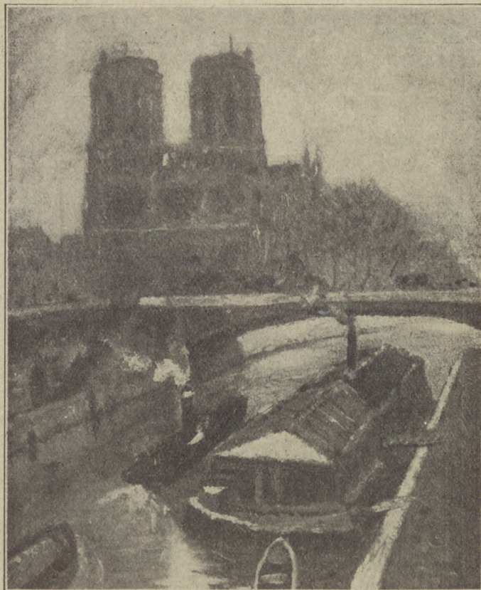
Haranglábi Nemes József „Notre Dame de Paris” című olajfestménye.

Időnkint kell is ezért, úgy mint más sportnál, bajnoki mérkőzéseket rendezni, hogy lássuk, ki legény a kontrában, ki a nagy mester?