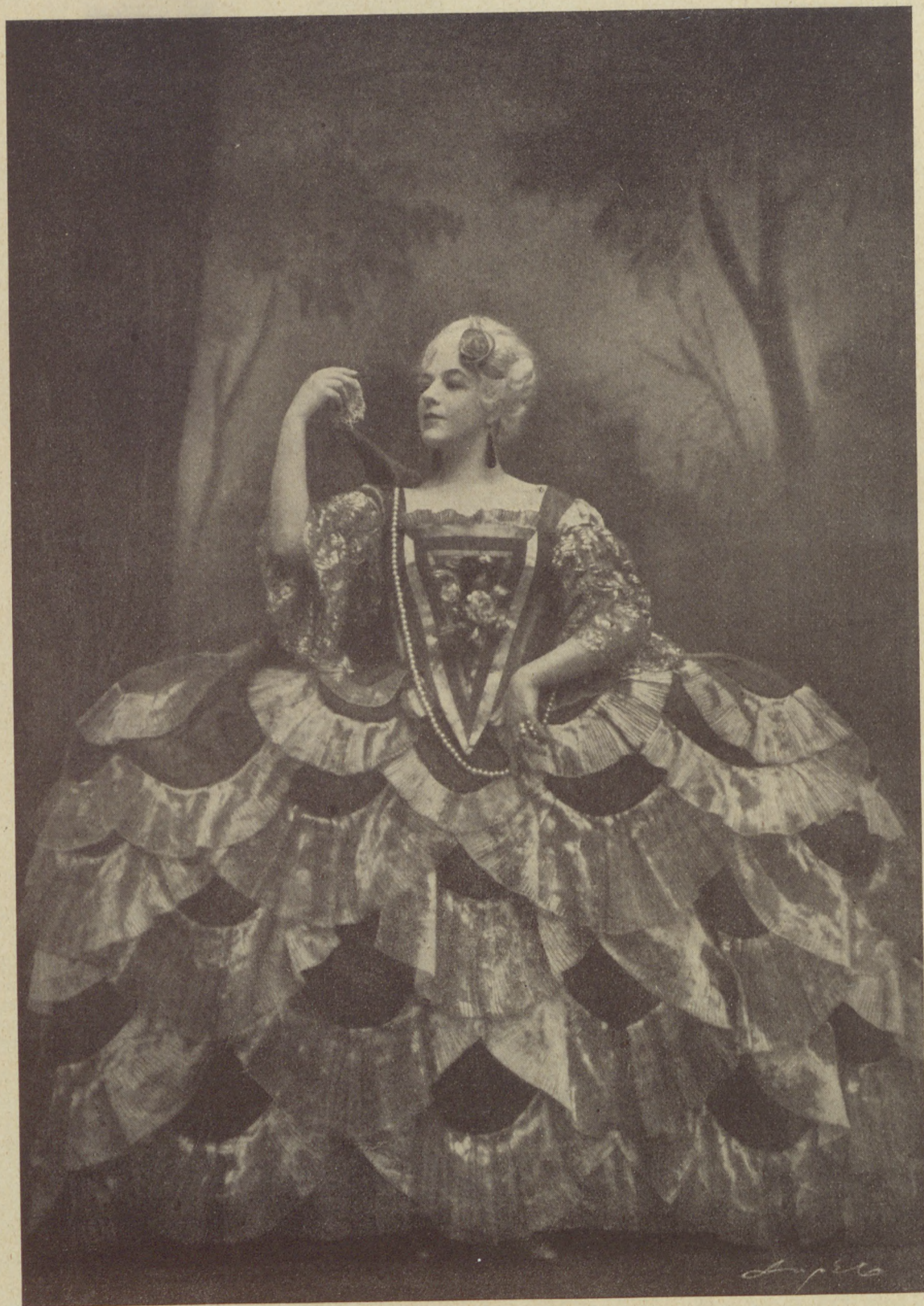
Fedák Sári a »Pompadour« címszerepében.