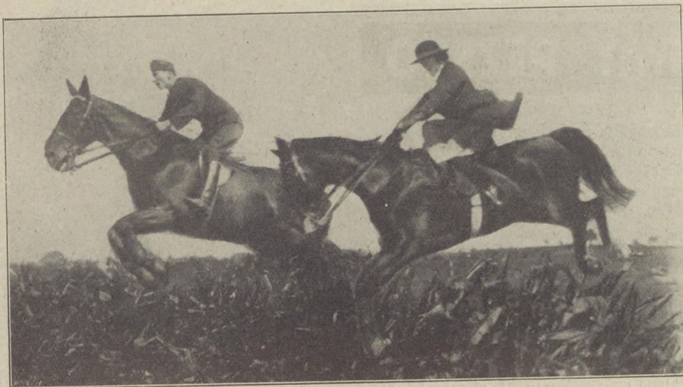
Akadályugrás a folnai vadászversenyen.