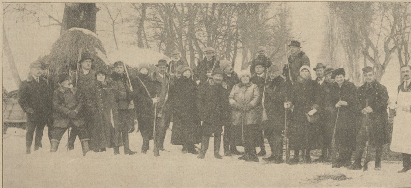
A drávaerdőpusztai nagyvadászat. A vadászat résztvevői a szilencsi nagy kör után.